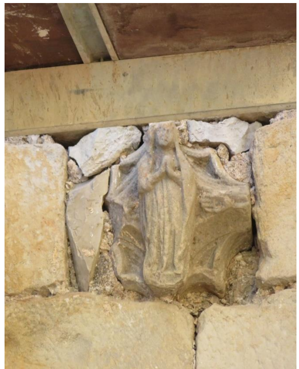
Fragment del Peiró original de Sant Joan de Penyagolosa