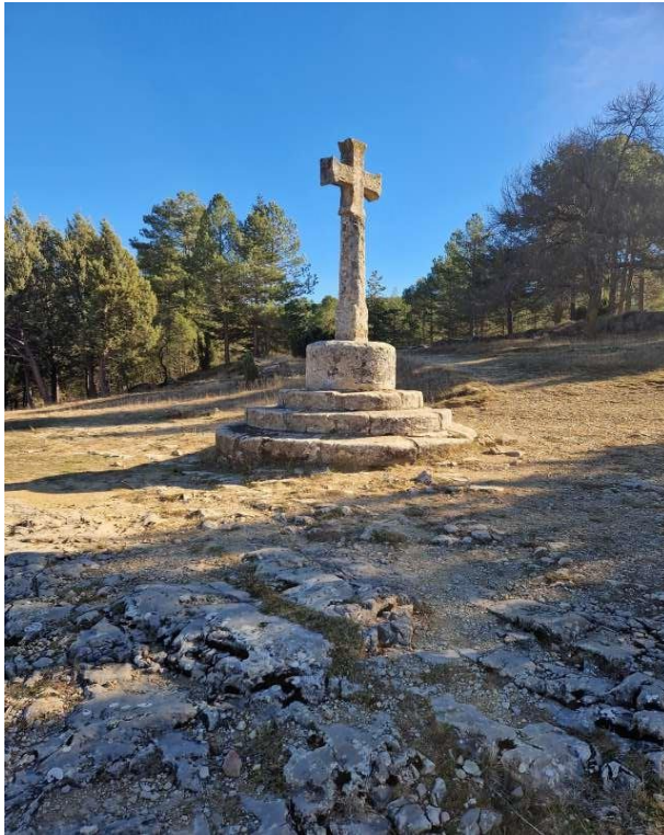
Peiró Sant Joan de Penyagolosa