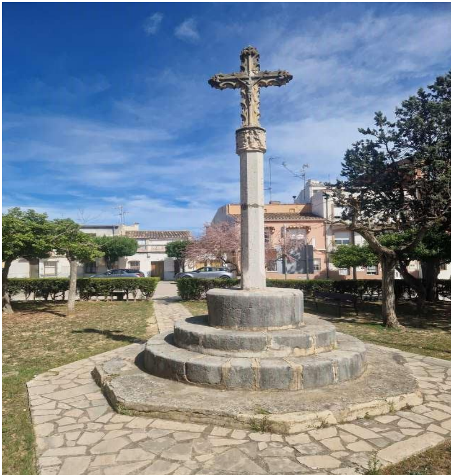
Peiró a Sant Mateu