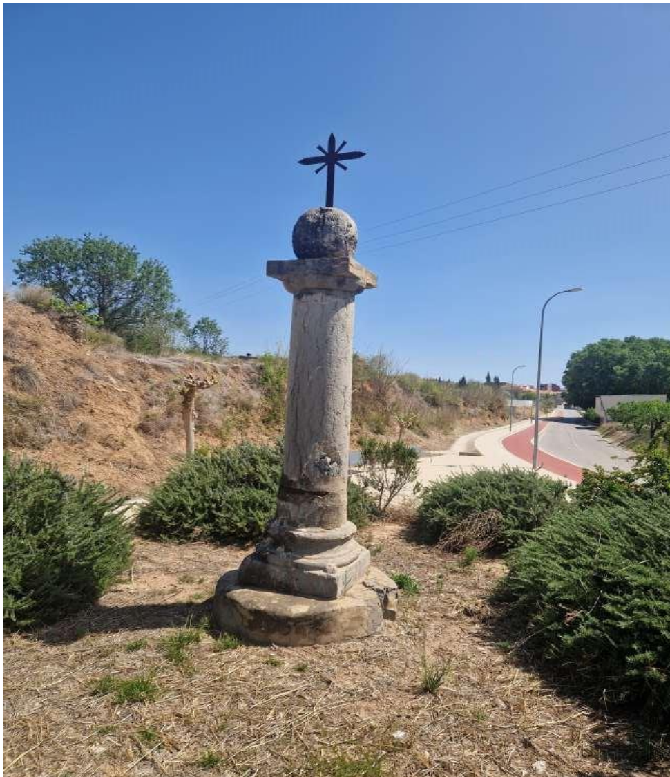
Creu al terme de Xèrica