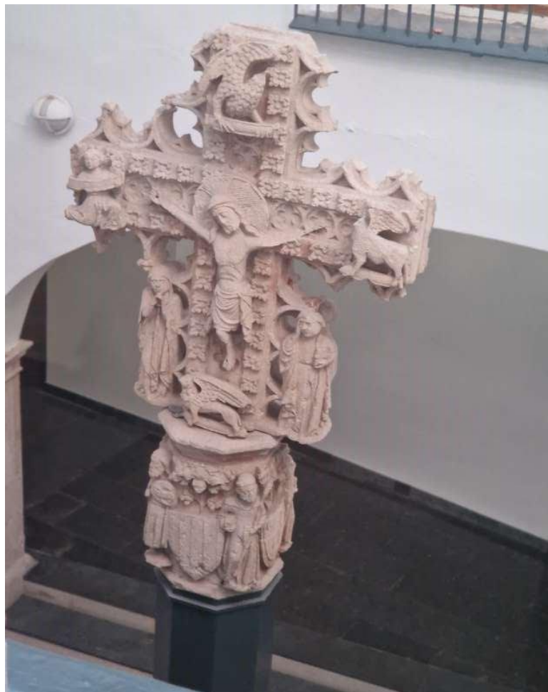
Creu de la eixida de la ciutat al Camí de Xàtiva