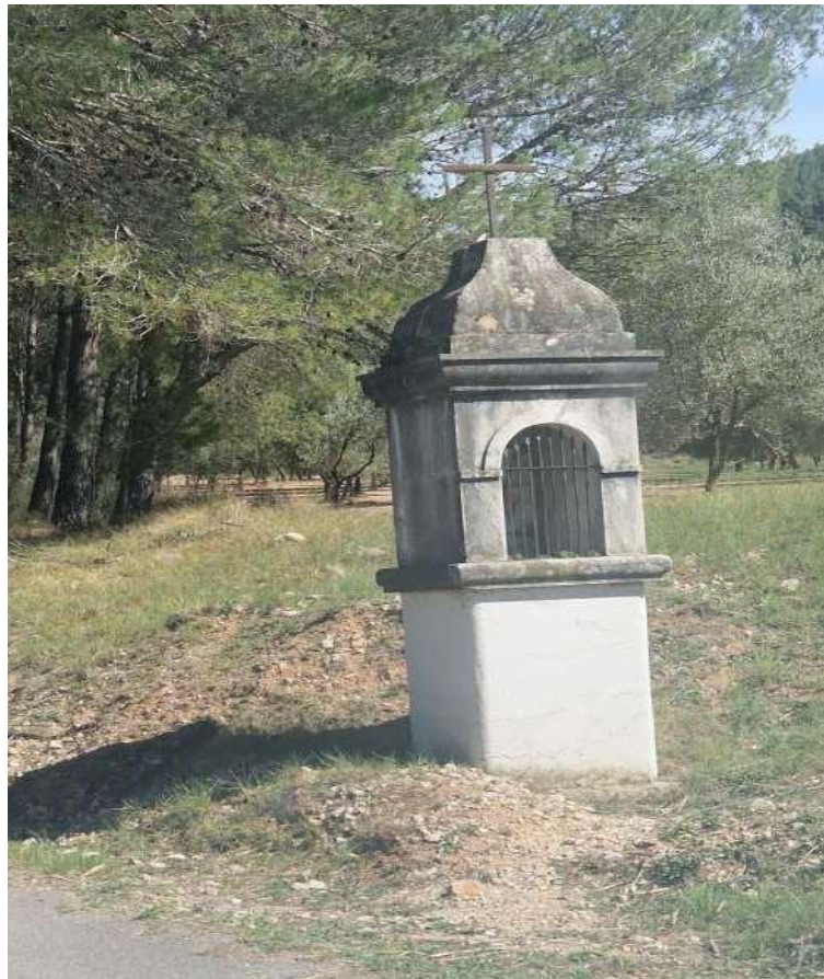
Capella Mare de Deu dels Angels, Sant Mateu

Si amb aquest escrit es pot col·laborar al coneixement per part de la societat d' un tema que pot ajudar a divulgar i fer més fàcil la vida en indrets abandonats o semi-abandonats, hauré aconseguit la motivació principal d'aquest treball.