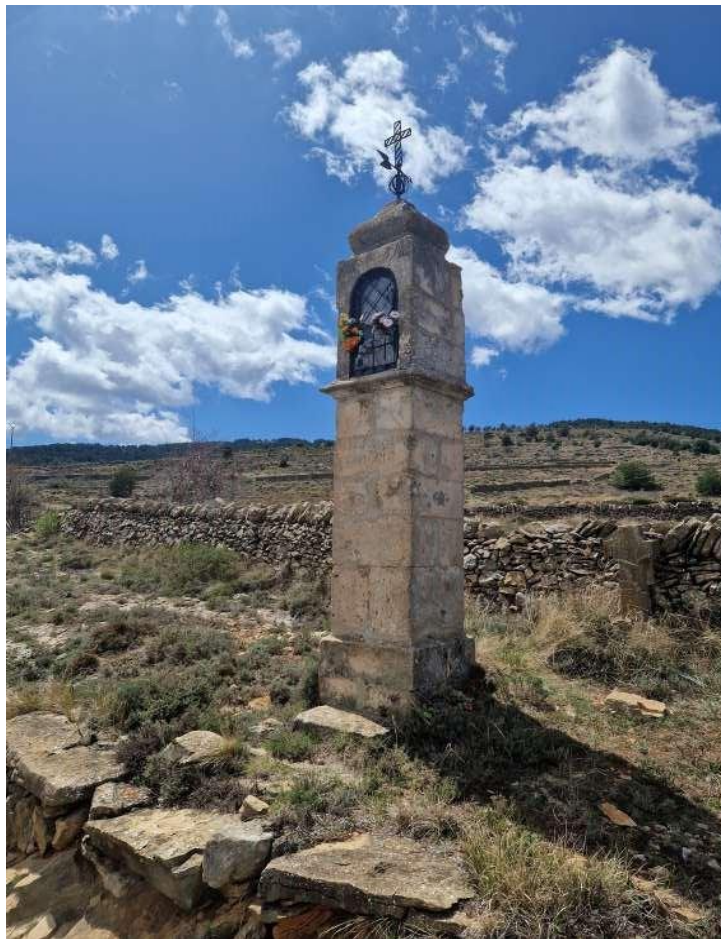
Peiró de la Mare de Deu del Pilar, Puertomingalvo.

Al conquerir terres i pobles que abans eren musulmans, marquen com a cristians els nous territoris que pertànyen, ara ja, a la seua jurisdicció. La forma de senyalar aquestes conquestes fou , entre altres ,la plantada de peirons d'algun tipus a les entrades dels llocs significatius cristians o a les poblacions per indicar la religió que tenien els seus pobladors.