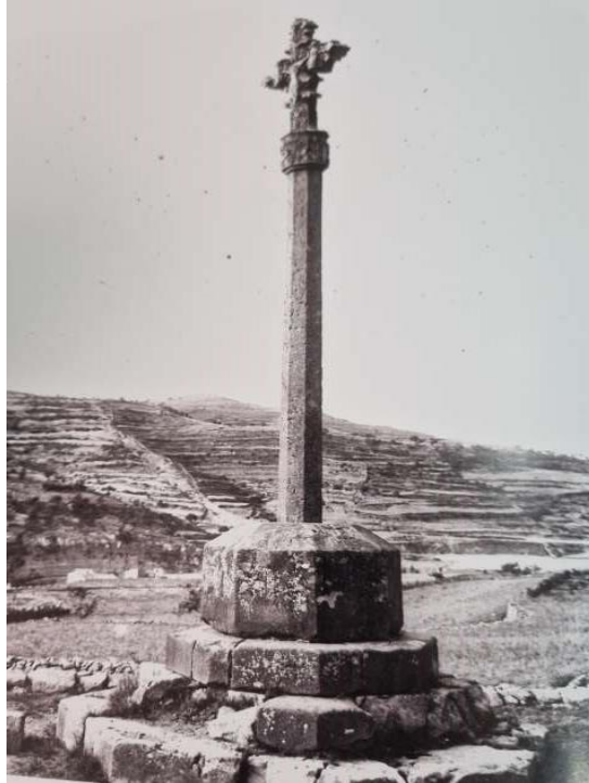
Creu del camí de la Todolella.