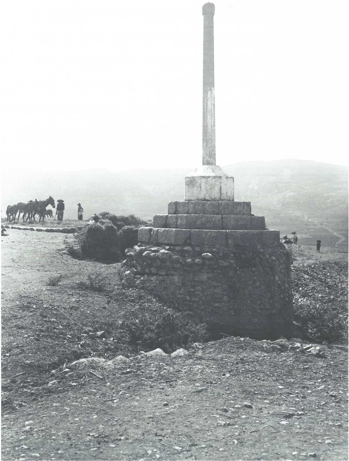
© 2021 Institut Amatller d'Art Hispànic - im. 05665032 (foto Mas C-24564 / 1918)