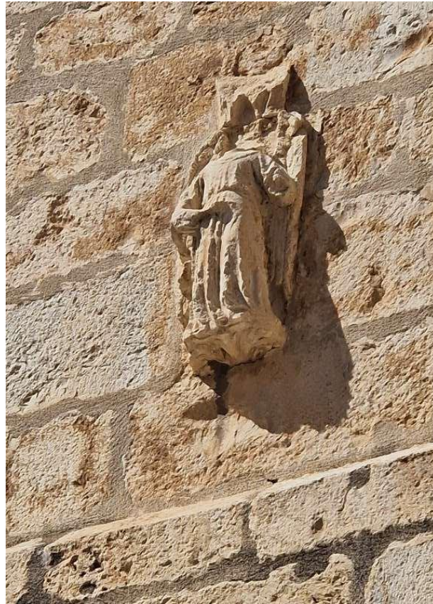
Campanar església Sant Mateu (inscrustació de un Peiró)

Sobre aquest pre-capitell o directament recolzant-se en el fust està el capitell pròpiament dit. Sempre està decorat amb elements que tenen relació amb el poble, àngels, querubís, constructors, etc... normalment són quadrats, circulars o octogonals.