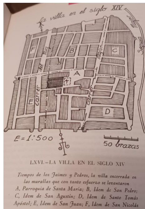
Muralles de la Vila en el segle XIV, ja suficientment contrastades.