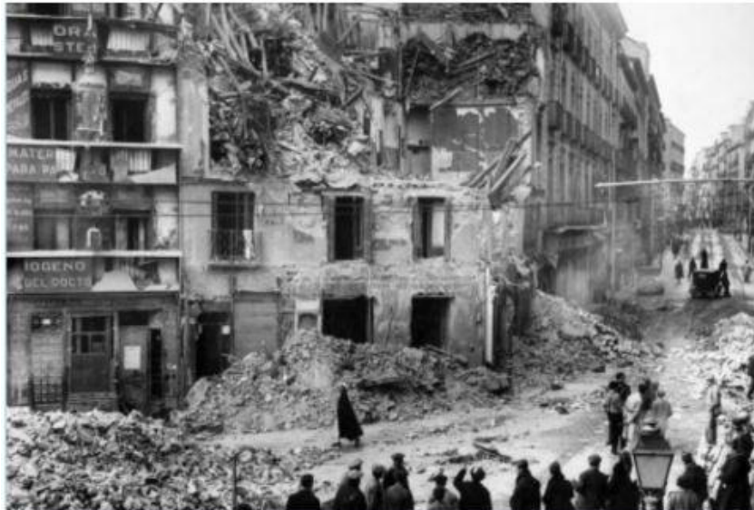
Ruinas tras el bombardeo.

Los fognazos, el estruendo de las explosiones, el humo negro, el olor acre, la polvareda blanca e irrespirable y el vuelo letal de cascotes y metralla irrumpiendo en medio de la gente, que se amontonaba entre los puestos del mercado, intentando escapar de la muerte.