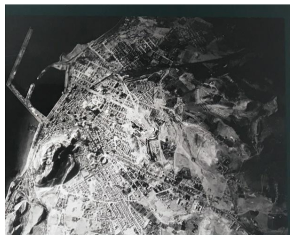
Bombardeo sobre Alicante.

Una escuadrilla de aviones cuya misión era machacar a la población civil desde una altura de solo 400 metros, sabe perfectamente donde soltar sus bombas para causar un elevado número de víctimas.