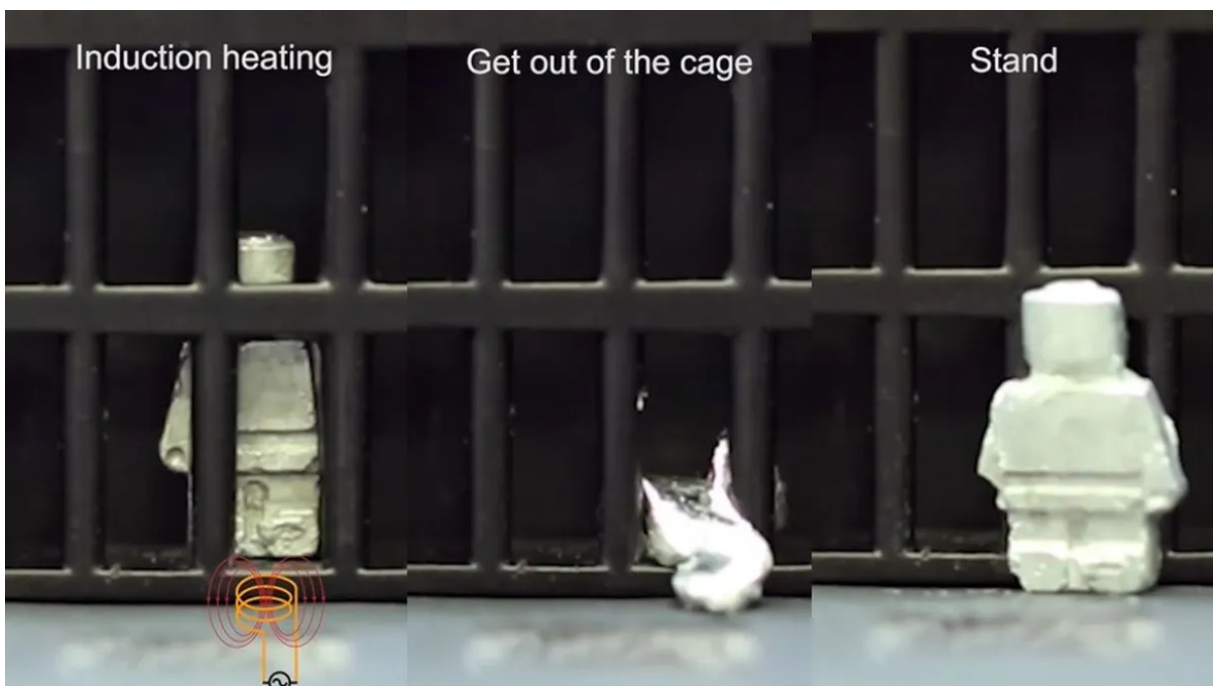
Izquierda: calentamiento mediante inducción, centro: el robot cruza la reja, derecha, el material se recompone