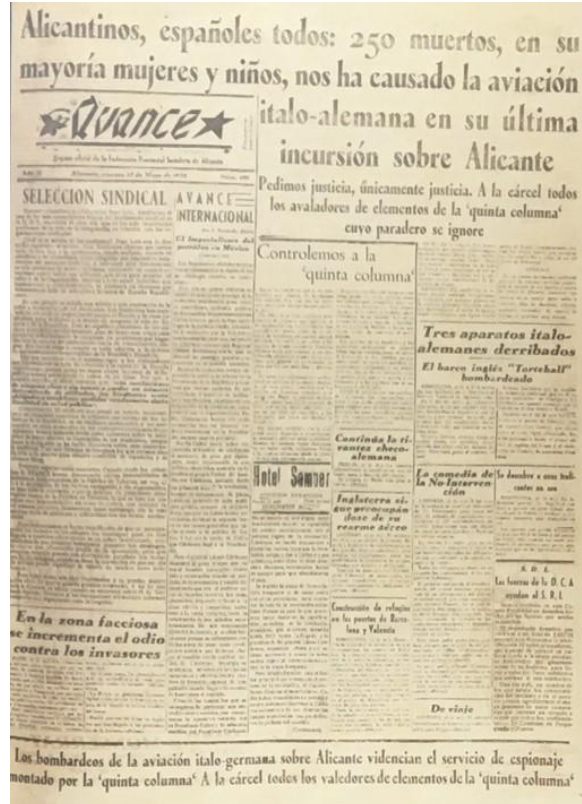
Periódico Avance 27 de mayo de 1938.

Lo acontecido esa mañana siempre fue silenciado. Quizás algún día la gente de Alicante pueda asistir a la inauguración del monumento, que al igual que las víctimas de Guernica, Atocha, o la zona Cerro de Nueva York, merecen los muertos del 25 de mayo.