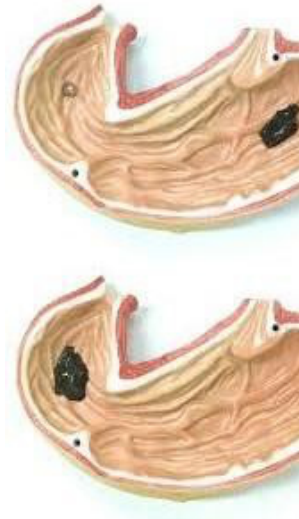
El robot es capaz de recorrer cavidades estrechas, algo que podría ser útil para usarlo dentro del cuerpo humano

[Qingyuan et al, 2023] Qingyuan, Wang & Pan, Chengfeng & Yuanxi, Zhang & Peng, Lelun & Chen, Zhipeng & Majidi, Carmel & Jiang, Lelun. (2023). Magnetoactive liquid-solid phase transitional matter. Matter . 6. 10.1016/j.matt.2022.12.003.