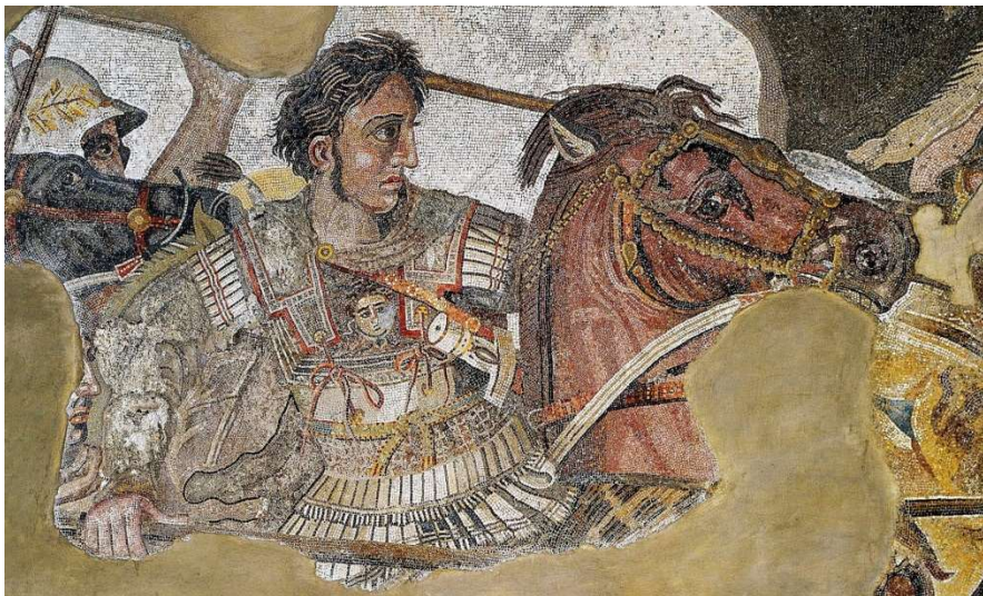
Mosaico de Alejandro Magno en la batalla de Issos