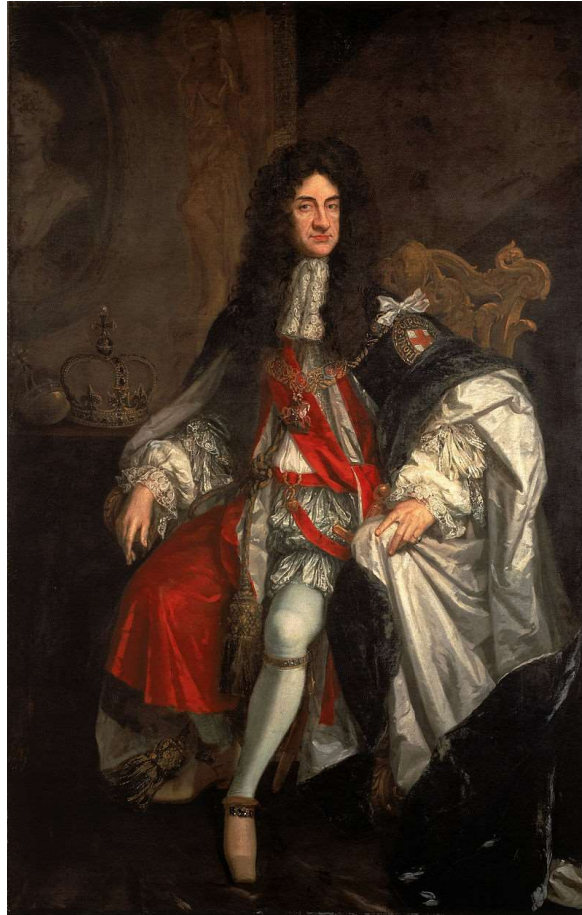
Carlos II de Inglaterra año 1685