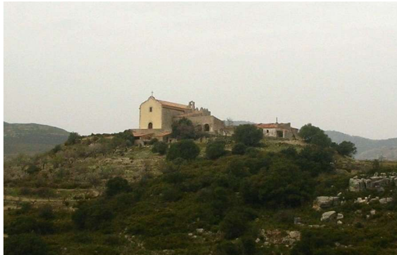
Ermita de S. Marc de la barcella de Xert

Cuando se organizaban en Anroig acudía la gente de la partida de “Molinars”; masías del “Molinar de Dalt”, “La Senieta” y “Molinar de Baix”. Todas estas personas solían llegar todas juntas y en muchas ocasiones comentaban: faltan los dels “Molinars”, o los dels “Molinars” no. Poco a poco, la expresión fue abreviada y pasó a llamarse: faltan los “molinaros”, o los “molinaros” no, o vendrán los “molinaros”.; Y así se les quedó este apodo aunque más tarde se fueron a vivir a otro lugar.