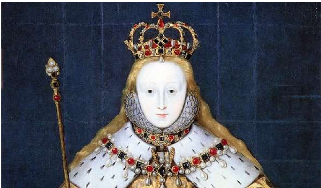
La reina virgen de Inglaterra Isabel I, o Elizabeth I (1533 – 1603)

¿Y si el apodo que le ponían no era de su agrado? Pues para algunos, posiblemente era mejor que la Reina le pusiera un apodo, porque si no lo hacía, significaba que esta persona le caía mal y solo por eso, podía encerrarlo en prisión e incluso cortarle la cabeza. Por tanto, el uso de apodos o nombres “insólitos” ha formado parte siempre de nuestra historia