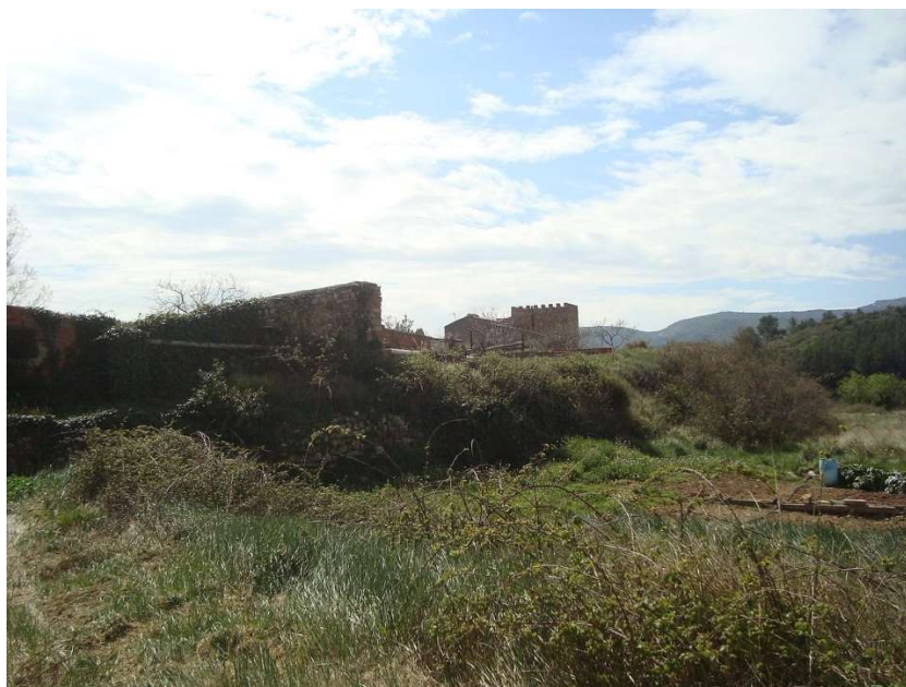
Masia fortificada Torreta del Molinàs de Xert