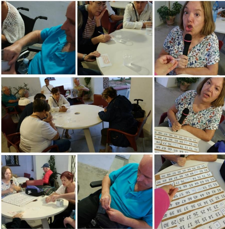
Ilustración 7 Bingo