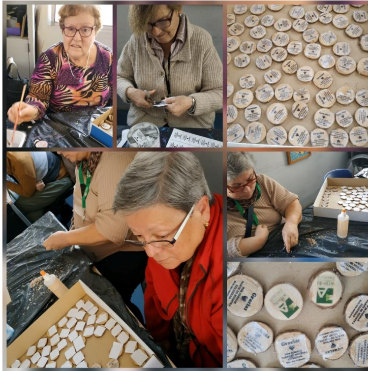
Ilustración 1. Taller de manualidades