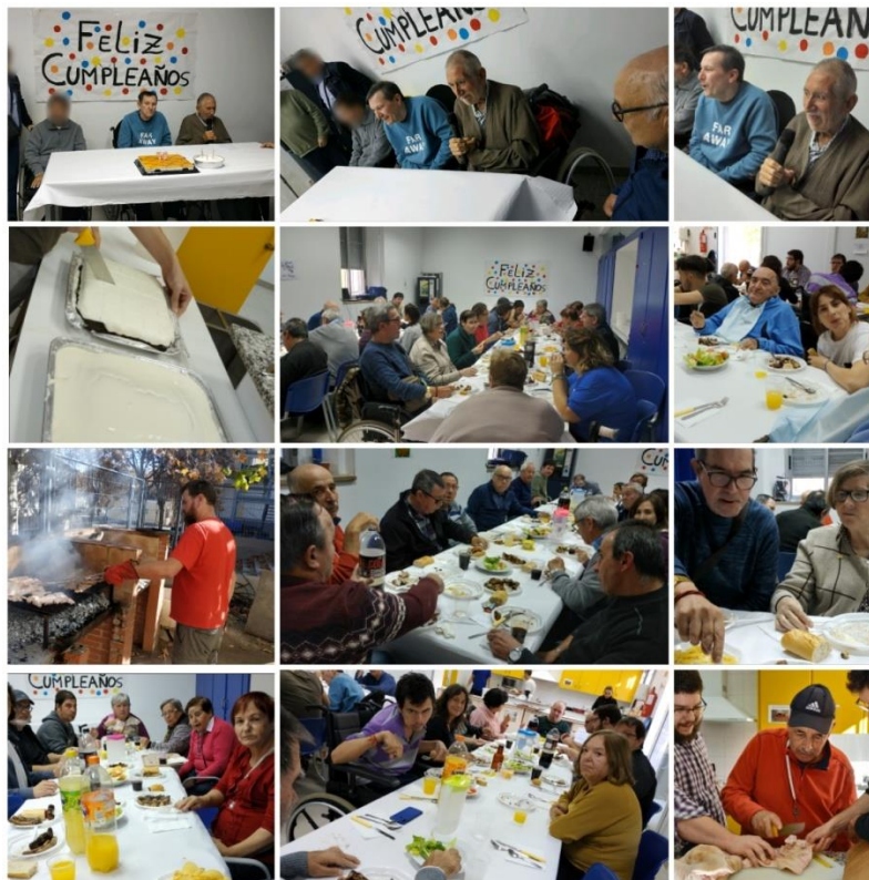
Ilustración 8 Fiestas y Cumpleaños