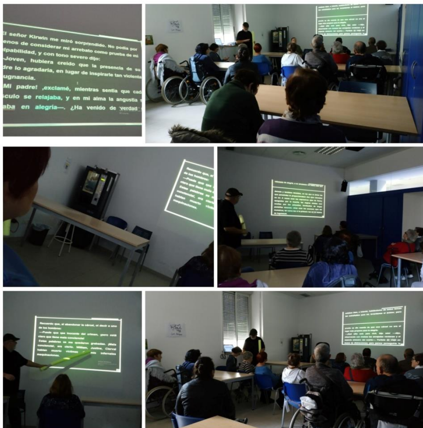
Ilustración 4. Tertulia Literaria dialógica