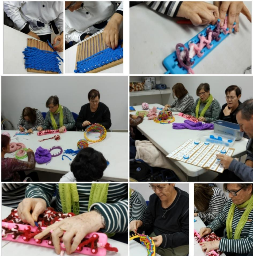
Ilustración 3. Taller de costura