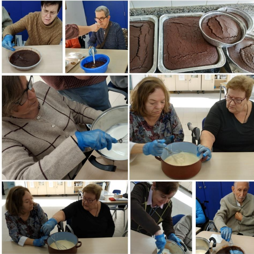
Ilustración 5. Taller de cocina