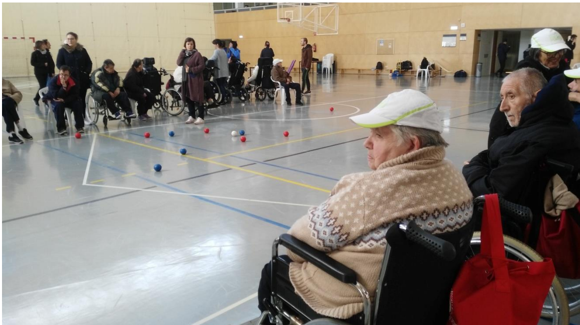
Ilustración 6. Boccia i deportes adaptados