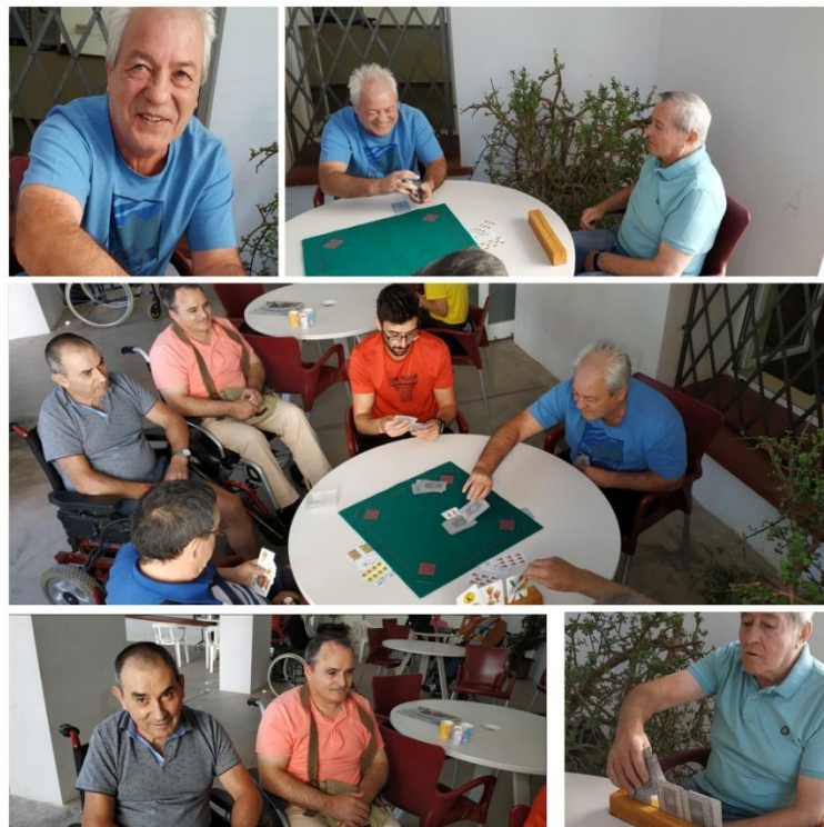
Ilustración 2. Juegos de cartas