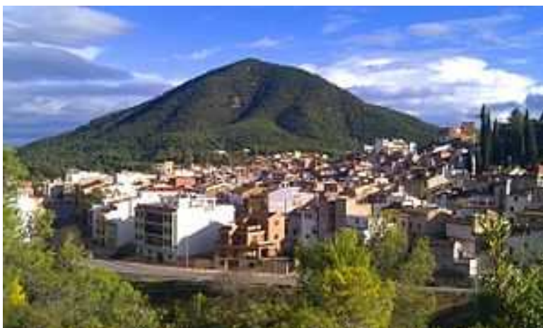
Ilustración 22 Vista panorámica de Tales https://ca.wikipedia.org/wiki/Tales_(Plana_Baixa)

Municipio del sur de la provincia de Castellón, en la comarca de la Plana Baja donde se integró la comarca histórica del Bajo Espadán de la que formaba parte. Pertenece a la Mancomunidad Espadà-Millars y alberga su sede.