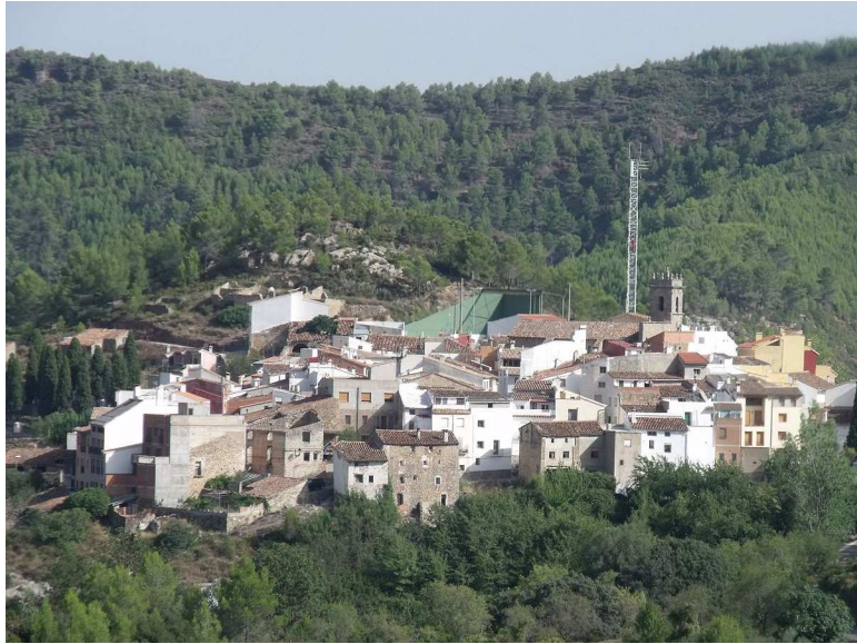
Ilustración 21 Vista panorámica de Villamalur https://ca.wikipedia.org/wiki/Vilamalur

Situada en la comarca del Alto Mijares, esta población es de origen árabe, a 644 m sobre el nivel del mar, cuenta con 63 habitantes y una extensión de 19,5 km 2 en los que predominan grandes extensiones de bosque. Su término muy accidentado en cuanto a su relieve se refiere. Destaca entre sus montes el Alto del Pinar, con una altura de 1.047 m. Sus calles estrechas y casas encaladas identifican su origen y recorrer su término es descubrir bellos parajes naturales de excepcional belleza. Merecen mención especial las cerezas de Villamalur, muy conocidas en los municipios de la zona.