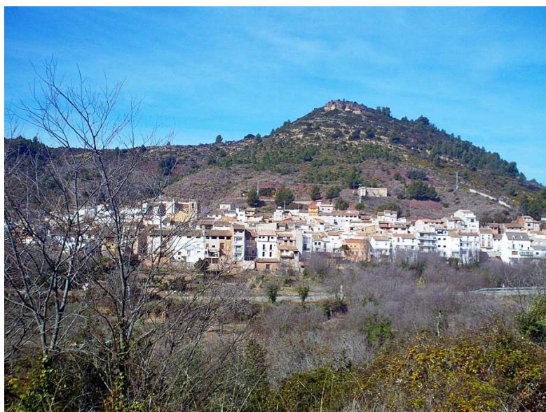
Ilustración 5 Vista panorámica de Algimia de Almonacid https://cronicasdelpalancia.blogspot.com/2019/03/localizan-al-anciano-perdido-en-algimia.html

Tras dichas expulsiones, la localidad fue repoblada por Pedro de Urrea con familias cristianas procedentes de Navarra y Puebla de Arenoso.