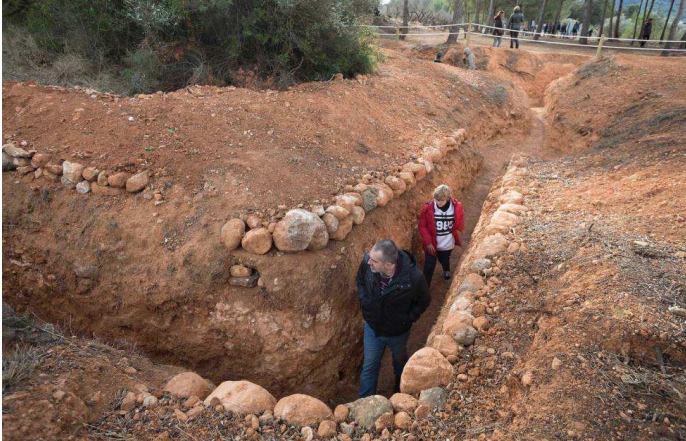
Ilustración 2 Trinchera de la Guerra Civil en Aín