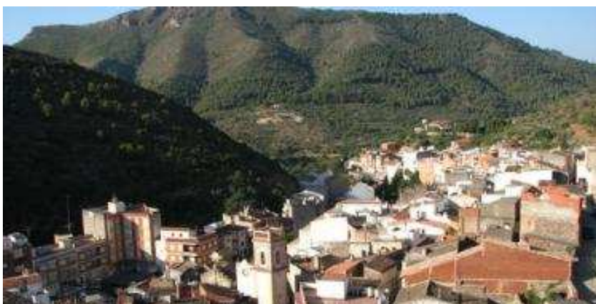
Ilustración 16 Vista panorámica de Higueras

Esta población, como todas las de la Sierra Espadán, ha ido mermando su