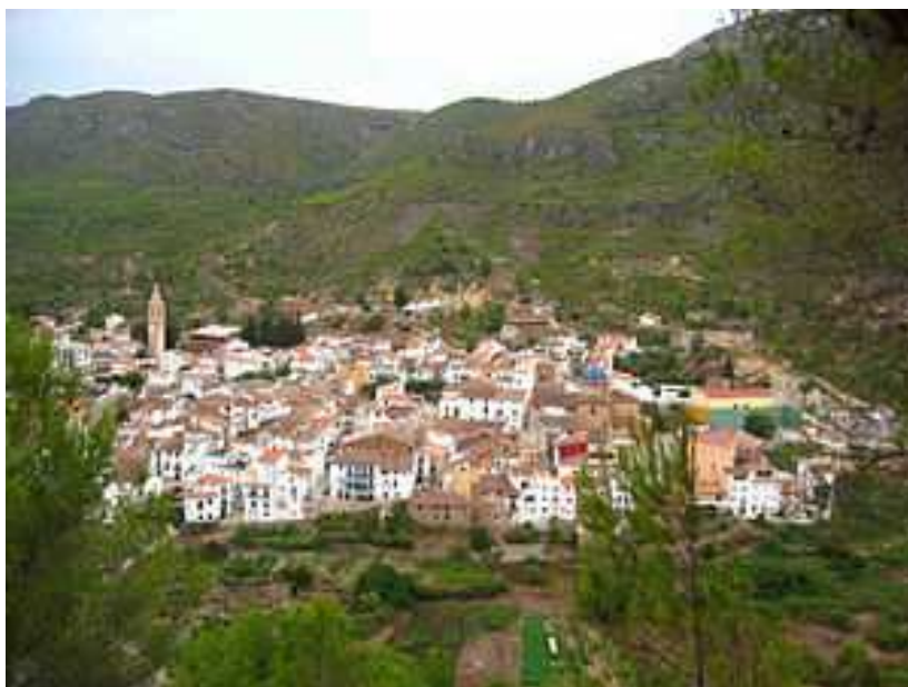
Ilustración 10 Vista panorámica de Ayódar

Es un municipio de origen musulmán. El castillo y sus dominios pertenecieron a Zayd Abu Zayd, el último gobernador almohade de València, que se retiró a esta comarca tras perder su territorio y pactar con el rey Jaime I.