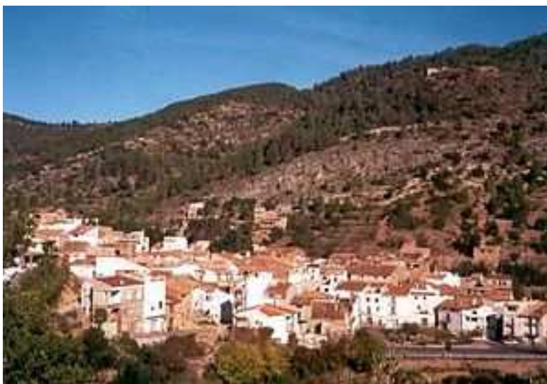
Ilustración 4 Foto panorámica de Alcuía de Veo https://ca.wikipedia.org/wiki/L%27Alc%C3%BAdia_de_Veo

Es un pueblo serrano, con su iglesia parroquial en medio de la plaza, y con arquitectura tradicional en las casas de sus empinadas calles. En cuanto al clima, los días fríos en la temporada invernal, no suelen ser numerosos. Las lluvias se producen con una gran irregularidad, estableciéndose fuertes contrastes entre los años de abundancia y otros de acusada sequía. Su economía está basada tradicionalmente en la agricultura de secano predominando el olivar, almendro, algarrobo y cerezo.