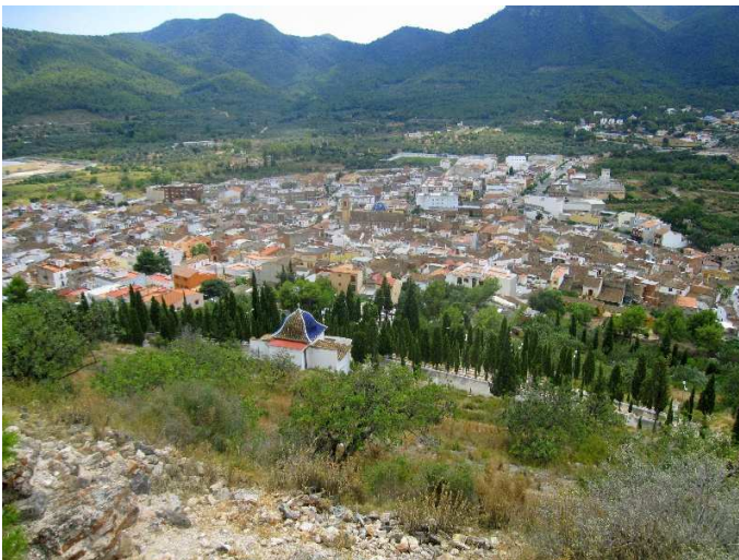
Ilustración 9 Vista panorámica de Artana

https://www.escapadarural.com/que-hacer/artana/que-ver