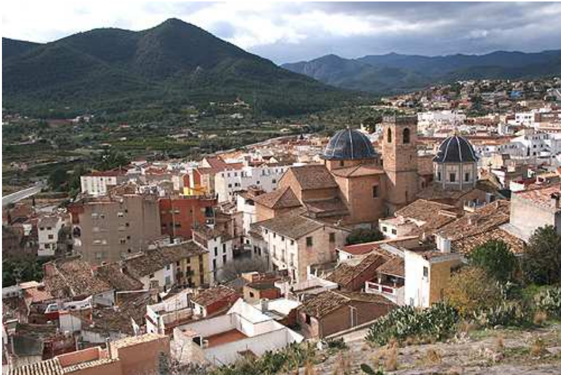
Ilustración 15 Vista panorámica de Onda https://castellonweb.net/onda-castellon-de-la-plana/