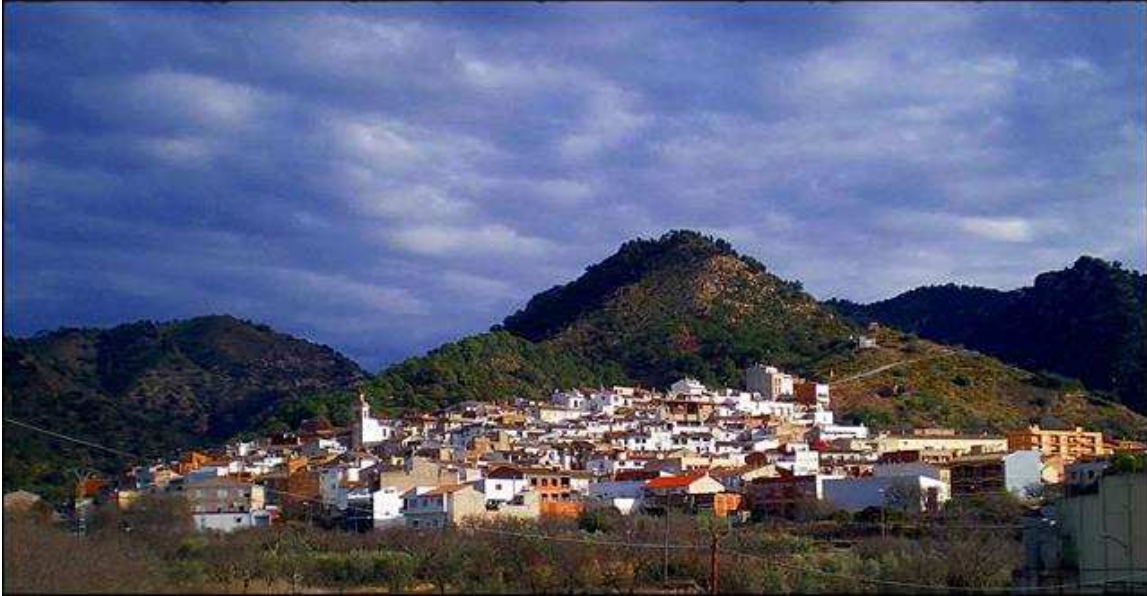
Ilustración 14 Vista Panorámica de Chóvar