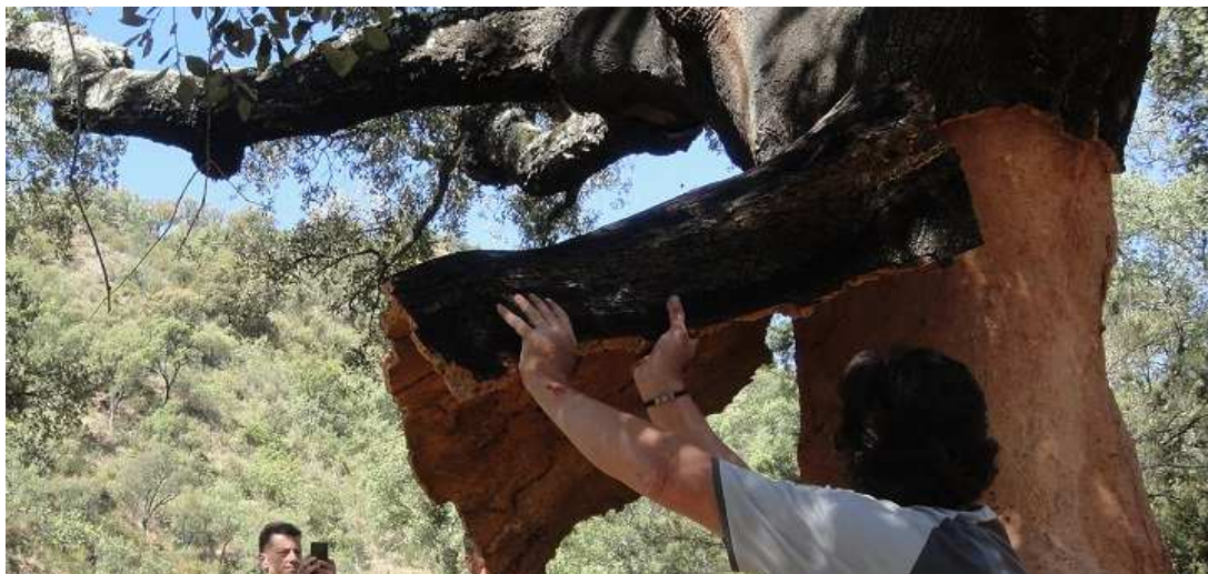
Ilustración 1 Saca de Corcho en la Sierra de Espadán

Esta pasión por los vinos y el cava repercutió en la cuenca mediterránea, en la Sierra de Espadán concretamente. De hecho, los alcornoques de estas estribaciones ibéricas son el máximo exponente del alcornocal en toda la región valenciana. Con todo, su contribución al auge de la industria del corcho fue notable.