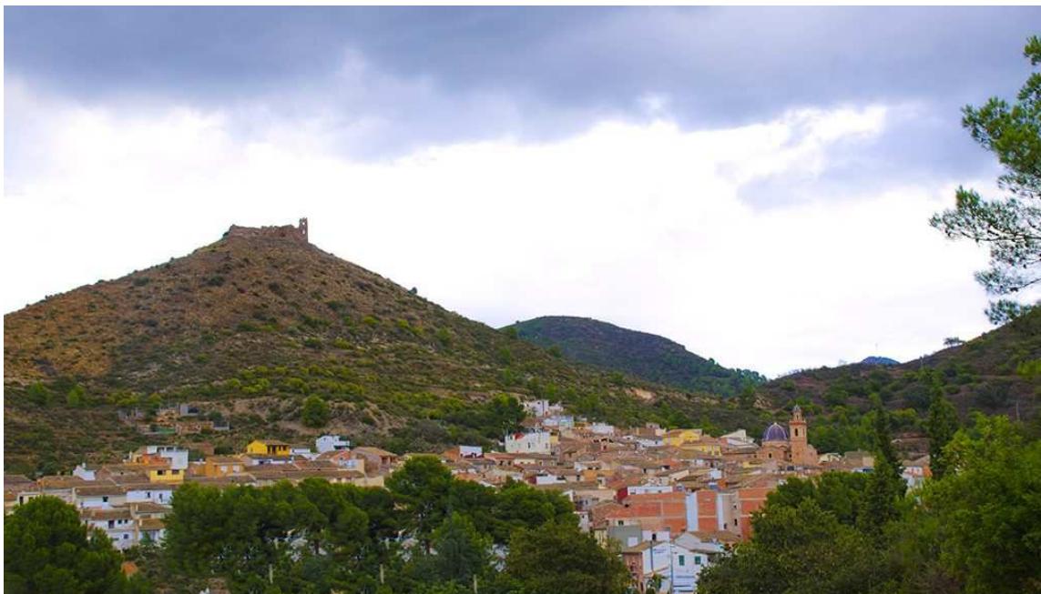
Ilustración 13 Vista panorámica de Azuébar https://altopalancia.es/municipio/azuebar/

El núcleo de la población se encuentra encaramado en la ladera soleada de una montaña, a 298 m de altitud , en cuya cima se encuentra la silueta de lo que en su día fue el castillo . El término municipal es muy escabroso debido a la orografía de la Sierra. Si bien es cierto que, al estar en una de las estribaciones de ésta, las alturas no son muy elevadas. Ello le permite contar con una enorme riqueza de