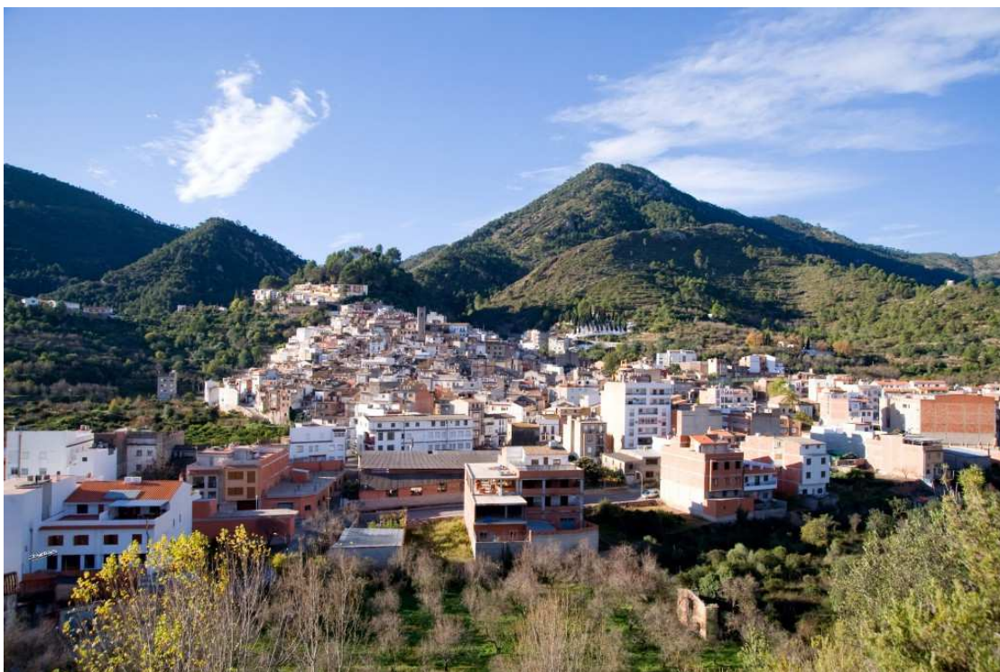
Ilustración 6 Vista panorámica de Eslida http://www.visitteritorioscorcheros.es/proiect/eslida/

Eslida también se encuentra a 5 kms. de Ahín, pero en otra dirección, hacia Nules y pertenece a la Plana Baja. Con una elevación de 380 m. sobre el nivel del mar, tiene una población de 800 habitantes valenciano hablantes, aunque en la temporada estival llega a alcanzar los 4.000.