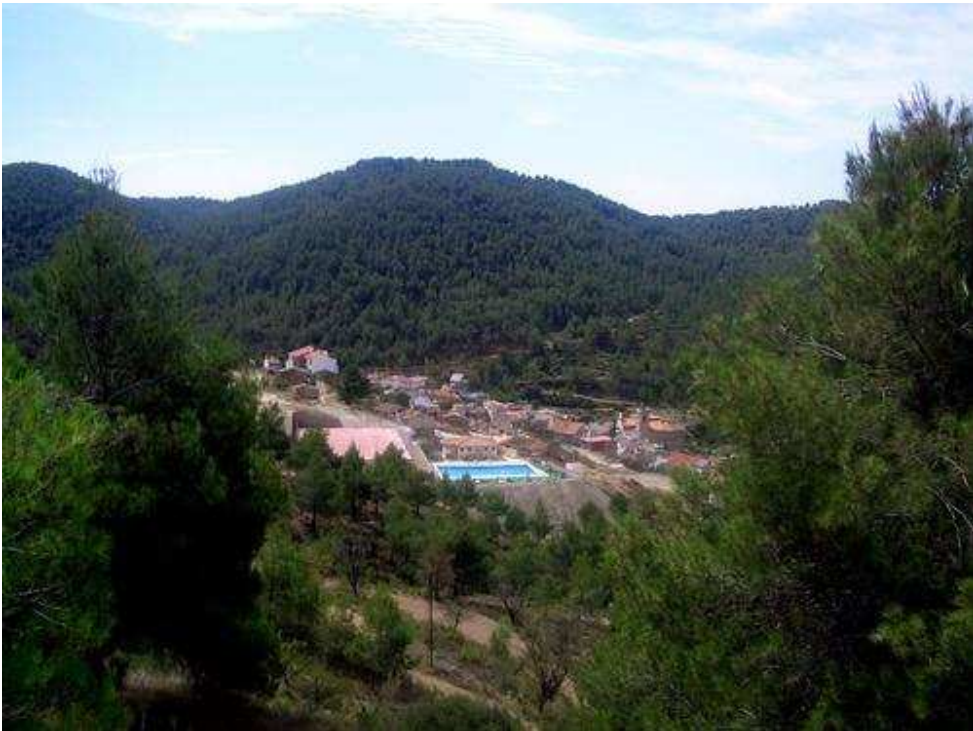
Ilustración 18 Vista panorámica de Pavías

Municipio de la comarca del Alto Palancia, situado en la zona occidental de la Sierra de Espadán. Con una elevación 738 m y 14,4 km 2 , tiene 69 habitantes valenciano parlantes.