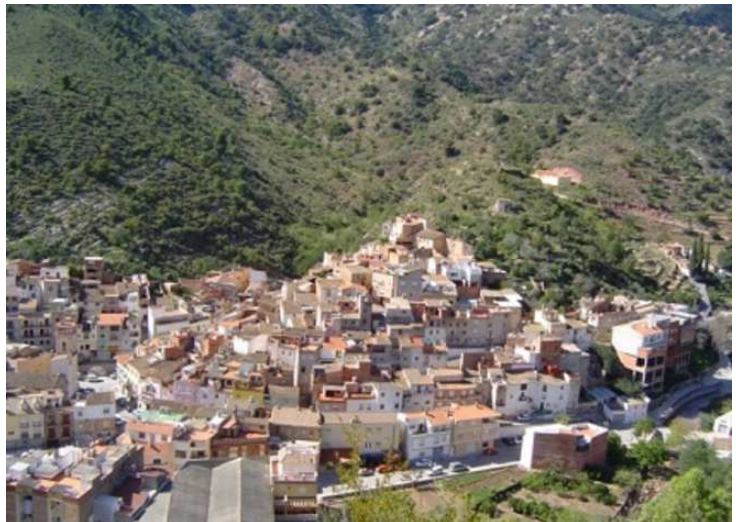
Ilustración 7 Vista panorámica de Alfondeguilla

Tras la conquista, perteneció a los condes de Ripalda y al Ducado de Medinaceli.