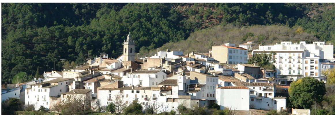
Ilustración 3 Vista panorámica de Aín http://www.ajuntamentdain.es/

Es un pueblecito con mucho encanto en el corazón de la Sierra, en la vertiente septentrional de la Sierra de Espadán cerca del pico Espadán (1.039 m).