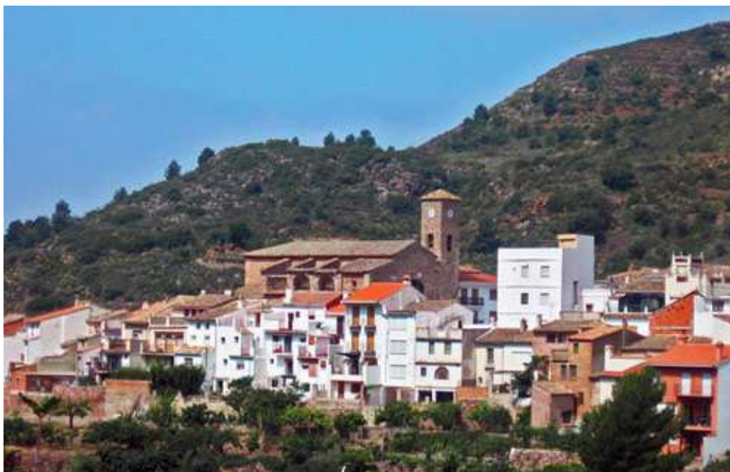
Ilustración 8 Vista panorámica de Almedijar https://www.vivecastellon.com/almedijar.html

Aunque hay algún yacimiento del periodo íbero y han aparecido algunos restos romanos, la localidad tiene un claro origen musulmán. Fue conquistada por Jaime I en 1238 y, tras diversos cambios, la localidad pasó a formar parte de la familia Centelles.