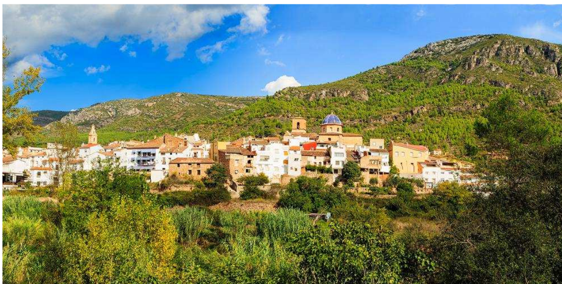
Ilustración 11 Vista panorámica de Fuentes de Ayódar http://castellon-en-ruta-cultural.es/detalleruta/ruta-por-el-rio-chico-y-el-pozo-negro-de-fuentes-de-ayodar/

En 1565 Fuentes contaba con 15 vecinos. Después de la expulsión de los moriscos en 1609, se repobló con cinco familias de agricultores de Godella (Valencia) decretándose la carta puebla el 17 de septiembre de 1611.