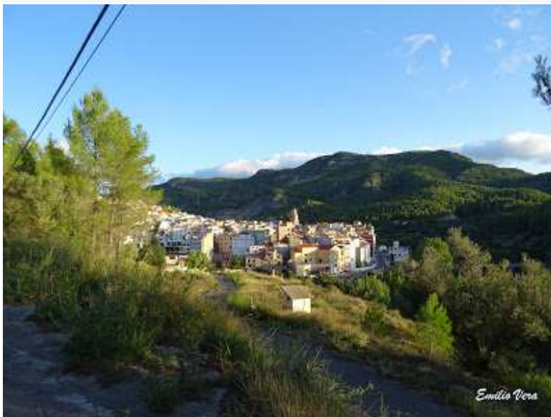
Ilustración 19 Vista panorámica de Torralba del Pinar

Con una altitud de 729 m, cuenta con tan sólo 54 habitantes castellano hablantes. Se trata de una población fortificada de planta circular que contó con una sólida muralla y una torre mayor central. La fundación del municipio por su toponimia es anterior a los árabes, pero la permanencia a lo largo de los siglos de los moriscos, ha originado que su casco urbano siga manteniendo un clarísimo aspecto morisco.