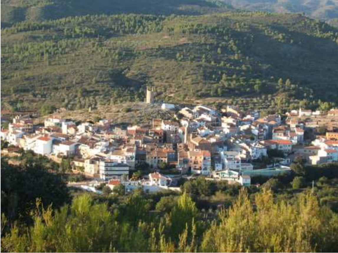
Ilustración 17 Vista panorámica de Matet

https://www.google.com/search?q=matet&rlz=1C1GCEU_caES841ES841&source=lnms&tbn=isch&sa=X&ved=0ahUKEwi hmN_ey4viAhXuBWMBS8mCLwQ_AUIDiqB&biw=1366&bih=576#imqjii=ZaMHFzaKirPbjM:&imarc=KJxaLzHQ6L5wM: