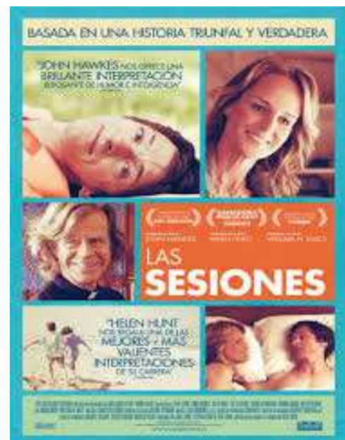
Cartel en Español de la película “LAS SESIONES”