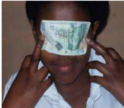
Fotografía alusiva al dinero y la prostitución

Lo cierto es que la prostitución, causa una gran alarma social, casi todos opinan que es un mal menor, pero que nadie la quiere cerca, según datos del