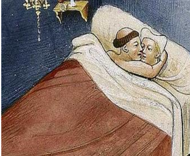
Imagen utilizada por Ana Karina Gourmete en SuperCurioso