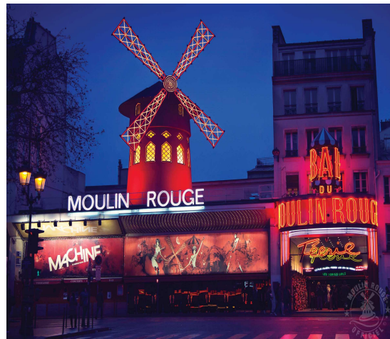
Fotografía fachada Moulin Rouge París