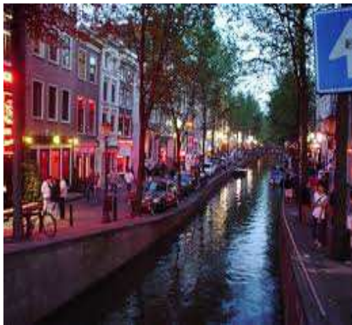
Instantánea del Barrio Rojo de Amsterdam

grandes cabaret fue de medianos del siglo XIX hasta, el último tercio del siglo XX donde se han visto obligados a reinventarse, pero en las cercanías de estas famosas Salas de fiesta se practica la prostitución cuando menos callejera.