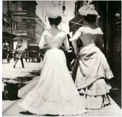
Antigua fotografía de la Gran Vía

Aconsejaba no tener sexo los Jueves, los Viernes, y los Sábados, recomendaba practicarlo durante la noche, y en los treinta y cinco días antes de Navidad, abstinencia total así como los cuarenta días antes de Pentecostés.