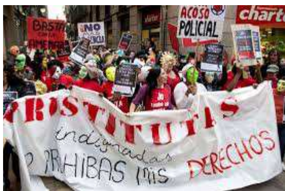
Imagen manifestación en defensa de los derechos sindicales de la prostitución

Imagen de manifestación a favor de la legalización de la prostitución