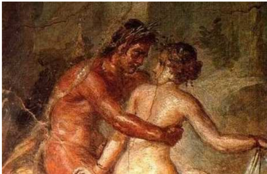
Imagen de la sexualidad Romana, Internet RSSing.com

Como se ha dicho además de precisar la licencia, para poder ejercer dentro de la ley, era obligatorio el pago de unos impuestos.