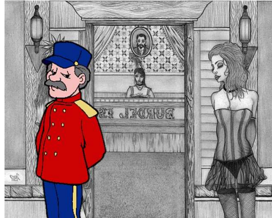
Dibujo, entrada de un Burdel procedente de Internet y de autor desconocido.