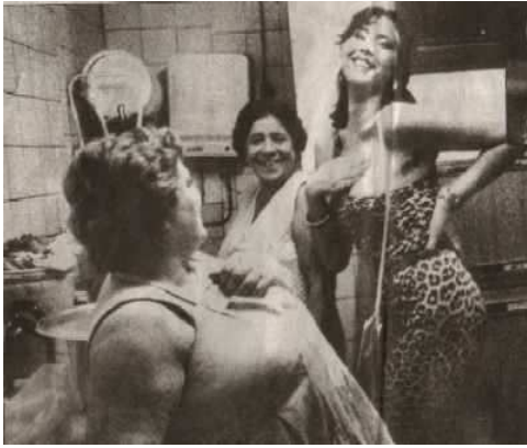
Prostitutas en un Mercado años 50

Pero vamos a pasar de puntillas sobre esta época sangrienta, y centrarnos en la segunda mitad del siglo XX. No sin antes apuntar, que en la época de la Segunda República Española, las prostitutas en España disponían de una libreta sanitaria, que les habilitaba para poder ejercer la prostitución, estas tenían la obligación de mostrar a su cliente, si este así lo requería, la libreta con los datos sanitarios, y la fecha de la última revisión médica, en la época de la dictadura, al quedar prohibida la prostitución, esta libreta perdió su uso.