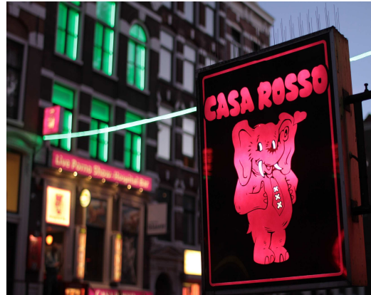
Fotografías de “Night Club y Wiskerías” procedentes de Internet

Los años setenta fueron algo más permisivos, se puso de moda otros tipos de local que ahora se llamarían “ Wiskerías ” estos eran locales algo más refinados que los tugurios que había en los barrios chinos, a parte de la situación, que podía estar fuera de los barrios dedicados propiamente a la prostitución, la edad y la cultura de las que en estos sitios trabajaba, al menos en un principio era una inferior y la otra muy superior, eran bares de copas en los que se podía tener acceso a unos reservados destinados a tal fin. Este tipo de local, en el siglo XXI, prácticamente ha desaparecido de todo el país, siendo sustituidos por los “ Nigth Club ” o también llamados “ Puti Clubs ” algunos de estos locales en las ciudades, otros la gran mayoría en carreteras, es extraño que recorriendo España encontremos alguna carretera en la cual no veamos las luces de neón, anunciando alguno de estos sitios. Estos clubs también han entrado en franca decadencia, mayormente por la competencia que tienen con Internet, pero aun así siguen funcionando, sobre todo con mano de obra extranjera inmigrantes que se han visto obligadas de dejar su país y a su familia por razones económicas, laborales, guerras, o simplemente engañadas por las mafias, con la promesa de un trabajo mejor y bien pagado, que ha resultado ser, una vez fuera de su país de origen, la esclavitud sexual, bajo amenazas y violencia física.