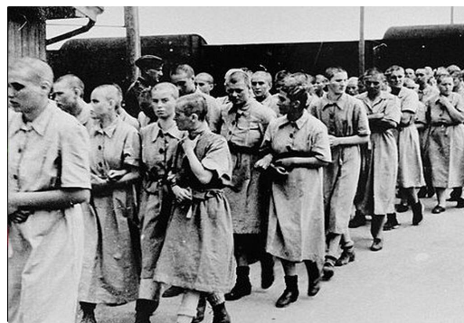
Campo de Reclusión alemán en la II Guerra Mundial