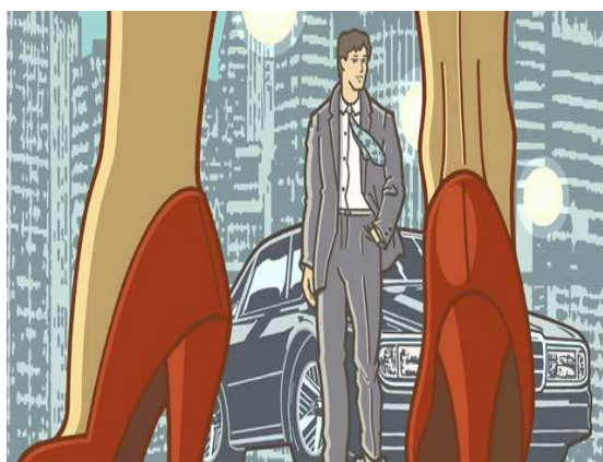
Foto y dibujo, alusivo a la prostitución- procedencia Internet

cualquier otro día de la semana, publicitándose en Internet, como medio de obtener clientes y de forma anónima, este intrusismo en el supuesto que un día llegara a legalizarse la prostitución, es seguro que con eso no desaparecería, en su mayoría es practicado, por “ decentes amas de casa ” con la que obtienen una ayuda económica extra y sus maridos, parejas, o familiares normalmente ignoran la segunda profesión del ama de casa.