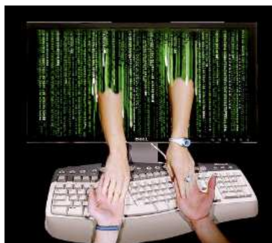
Imágenes alusivas a la prostitución en Internet

Por ultimo nos queda la prostitución en Internet; como consecuencia del anonimato que ofrece la red. La facilidad de acceso a miles de páginas, dedicadas a la prostitución es enorme, sin ningún control y de forma totalmente anónima,