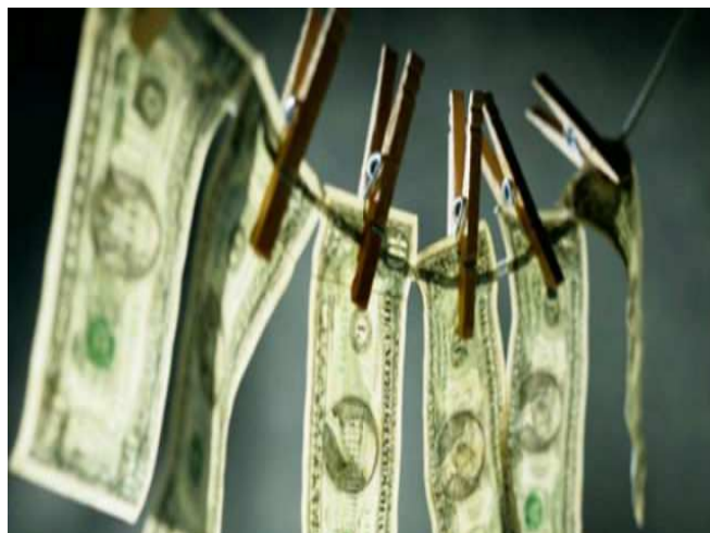
Fotografías alusivas a la prostitución y al dinero que esta genera.

Otro beneficio que la sociedad, obtendría con la legalización de la prostitución sería, el incremento en la aportación, que estas harían al Régimen de la Seguridad Social, ahora que tanto se habla de las pensiones, se calcula que las prostitutas podrían con sus impuestos aportar a las Arcas del Estado sobre unos 6.500 millones de euros anuales, si se legalizase su profesión, realmente una cantidad de dinero muy importante.