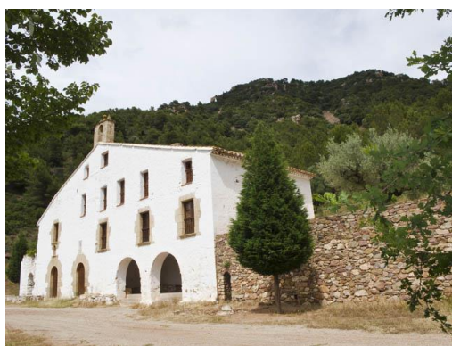
Ermita de Sant Miquel

También en el paraje natural del Mollet -un antiguo poblado fortificado medieval que tiene la consideración de Bien de Interés Cultural- encontramos la ermita de Sant Miquel. En el aspecto etnológico, la romería hasta la ermita de San Miguel, cada tercer domingo de Cuaresma y que organiza el Ayuntamiento desde el siglo XVII, constituye un elemento de gran interés y fuerte arraigo en la localidad.