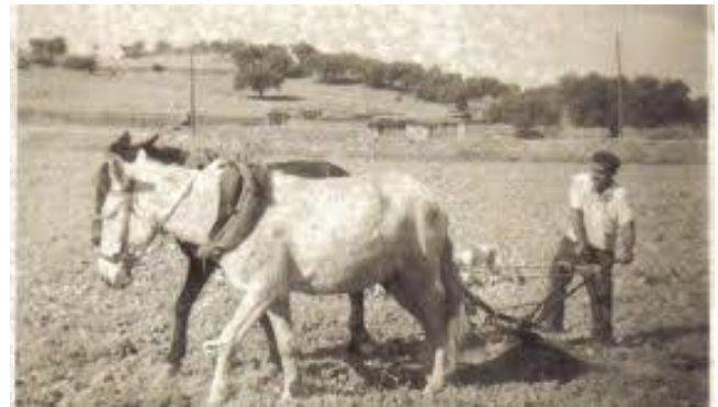
Caballo arando la tierra

La industria azulejera marca un giro en la vida de las gentes de San Joan de Moró y supone para el municipio un aumento considerable del número de habitantes así como la llegada desde los más diferentes puntos de España de gente en busca de un trabajo.