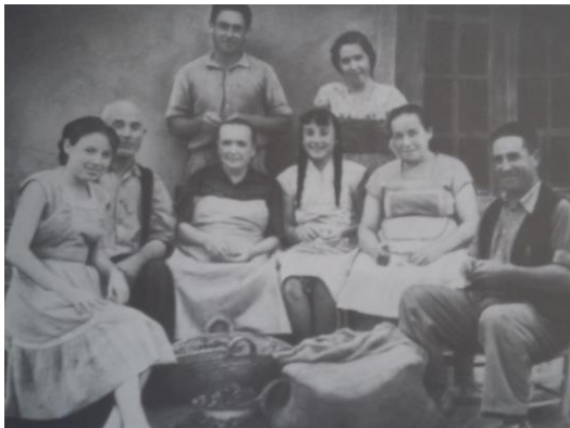
Familia pelando almendras

Las tierras que comprenden el término municipal de San Joan de Moró fueron hasta final de los años cincuenta tierras de cultivo. Almendros y olivos constituyeron durante varios siglos la base de la economía familiar de esta zona de la provincia de Castellón. Llegado el fin de esa economía agraria, el principio de la industrialización que se ha visto disparada en su crecimiento en la última década. La familia reunida pelando almendras o un caballo arando en el campo son imágenes hoy difíciles de ver: