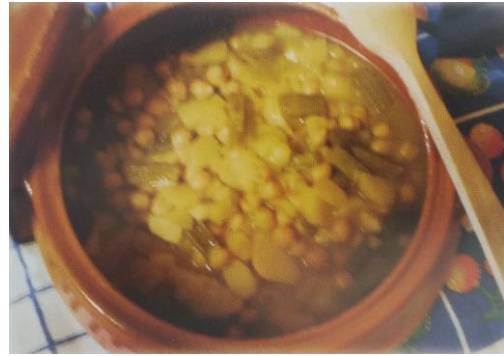
Olleta de cardinxes

Llenar una olla de agua y hervir durante una hora toda la carne. Después se añaden los garbanzos (hace falta que estén en remojo 24 horas), las patatas cortadas, la acelga, el cardo corredor y 2 tazas de agua y se deja cocer hasta que esté listo.