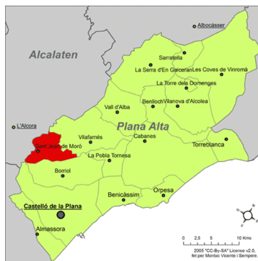
Localización geográfica Sant Joan de Moró

Sant Joan de Moró, municipio situado a catorce kilómetros de Castellón de la Plana y a siete de Alcora, capital de la comarca de l' Alcalaten , se halla en el valle que forma la Rambla de la Viuda, afluente natural del río Mijares. Se eleva ciento ochenta metros sobre el nivel del mar y linda al oeste con los municipios de Alcora, con su importante industria azulejera, de la cual Sant Joan de Moró se ha hecho eco, y Costur. Al este linda con Borriol y con el monte el Mollet y al norte con Vilafamés, municipio al cual se ha hallado ligado hasta épocas muy recientes, motivo por el que la historia de Sant Joan de Moró se halla íntimamente ligada a este.