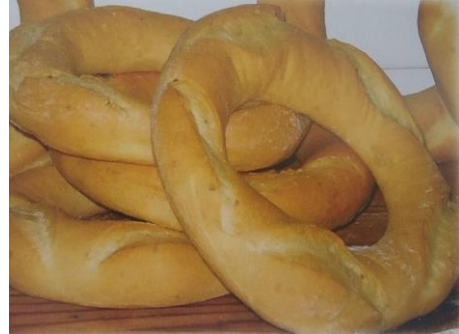
Rotllo de Sant Antoni