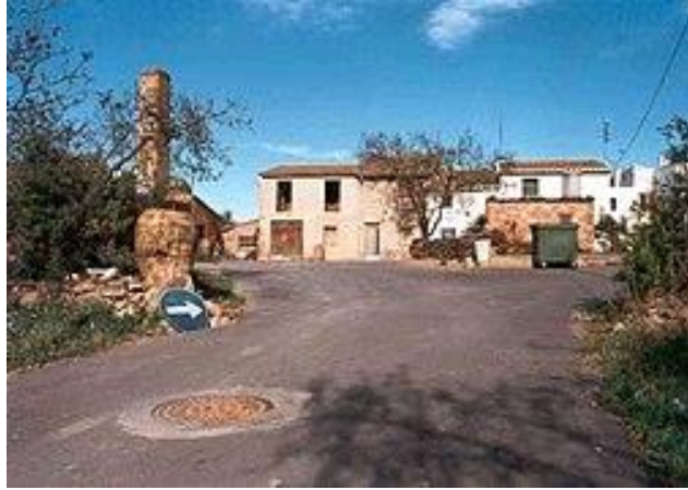
Mas de Masianos

Todo este conjunto viene a ser englobado por los barrancos de la Parra, la Ratxina y el Molí Roig , este último con una interesante fauna autóctona.