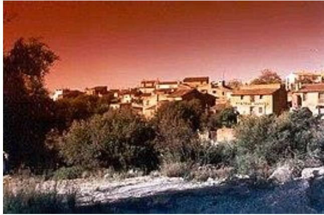
Mas de Flors

El Pla de Lluch se encuentra situado a la salida del pueblo, en dirección hacia Vilafamés. Se extiende de forma lineal conservando sus propias tradiciones. El Mas d'Armellers se encuentra ubicado en la falda del Tossal del Mollet , y muy próximo al Mas de Moró, conforma junto a este último un espacio visual desde el cual se divisa todo el Pla de Moró, e incluso en la lejanía, la gran Penyagolosa .