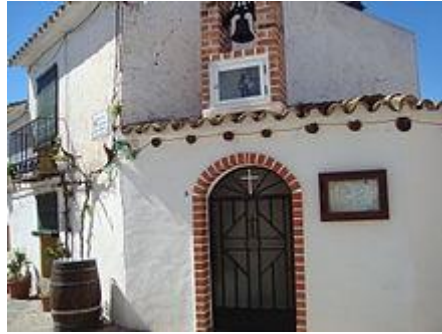
Ermita de San Antonio (Mas de Flors)

Finalmente mencionaremos también la ermita de San Antonio en el Mas de Flors , que podemos apreciar en la foto siguiente: