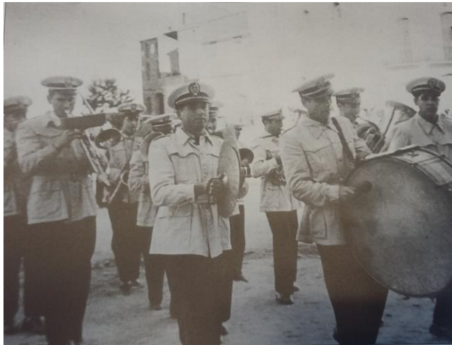
Banda de música (1940)

Entre las ceremonias, tal y como hoy continúa haciéndose cada curso escolar, los niños son fotografiados con sus compañeros de aula. El más antiguo de estos retratos data del año 1925, de tal manera que estas fotografías nos permiten establecer un recorrido visual por la vida, no solo de los alumnos, que pese al paso de los años parecen permanecer inalterables, sino también por la de esos maestros que no dudaron en envejecer enseñando en San Joan de Moró.