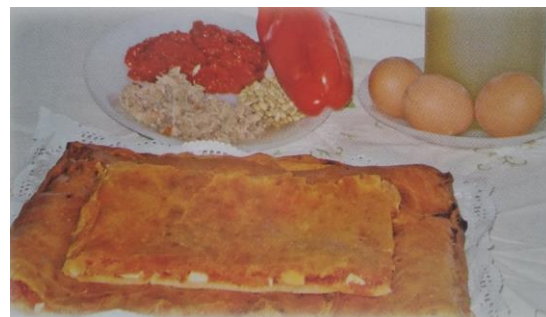
Coca de tomata

Para el relleno: 1 kilo de tomates maduros pelados y triturados, 1 pimiento, 1 cebolla, 2 huevos duros, 2 latas de atún en aceite, un puñado de piñones.