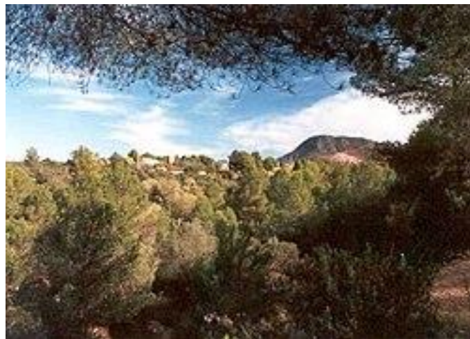
Tossal del Mollet

El Pla de Lluch se encuentra situado a la salida del pueblo, en dirección hacia Vilafamés. Se extiende de forma lineal conservando sus propias tradiciones. El Mas d'Armellers se encuentra ubicado en la falda del Tossal del Mollet , y muy próximo al Mas de Moró, conforma junto a este último un espacio visual desde el cual se divisa todo el Pla de Moró, e incluso en la lejanía, la gran Penyagolosa .