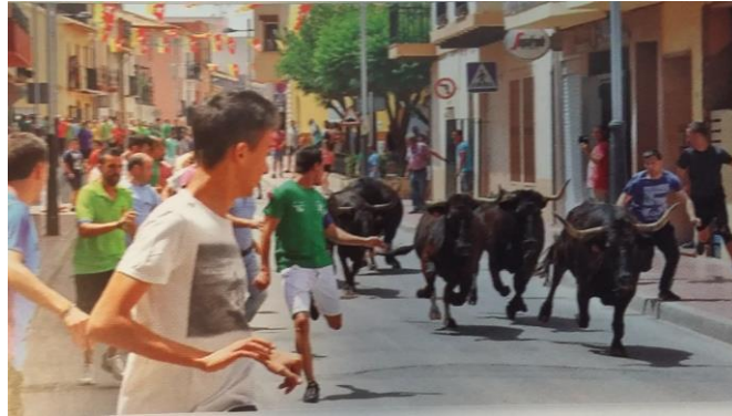
Bous al carrer

La música, el baile, los toros y la gastronomía están siempre bien presentes en sus celebraciones. De entre los diferentes festejos que celebra la localidad, las fiestas dedicadas a San Juan Bautista son los más destacados. Además de los espectáculos musicales de todo tipo se suceden las actividades deportivas y culturales, así como exhibiciones pirotécnicas y las degustaciones gastronómicas. Los toros también están presentes, tanto los de la plaza, como los bous al carrer .