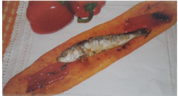
Coca de sardines