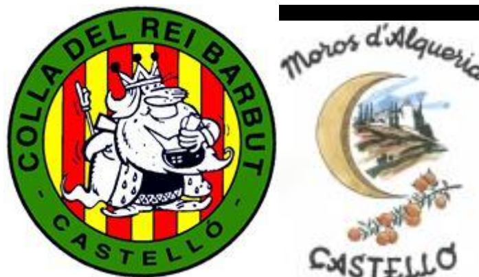
Foto 5: Logotipos de la Colla Rei Barbut y la Asociación Moros d'Alqueria

En los primeros años de la transición política hacia la democracia se había manifestado, cada vez con más fuerza, la reivindicación de unas fiestas más populares. Cabe destacar la constitución en 1976 de la asociación Moros d'Alquería y al año siguiente, el nacimiento de la Colla del Rei Barbut .