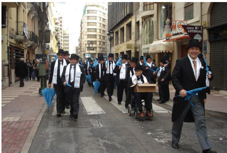
Foto 20: Año que se puso de moda la canción “Tengo la camisa negra” de Juanes

interpretada varias veces en la Plaza de Toros, saludando desde el tendido el autor: “Tengo la camisa negra”, ese año se cambió la camisa blanca por la camisa negra y el resto del uniforme en blanco; “Ramírez, Ramírez” en honor al diestro castellanense Alberto Ramírez, que toreaba esa tarde.