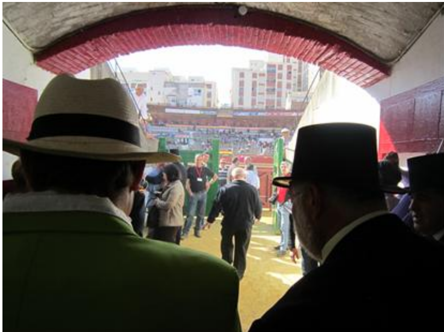
Fotografía 21: Inspeccionando el terreno.

En resumen, y a modo de conclusión de estas encuestas, participar y ser parte de esta “penya” es divertido, agradable y un orgullo. Participar no es cuestión de edad, sino de alegría. Los miembros no se plantean renunciar mientras el cuerpo aguante y la salud lo permita. La edad avanzada de sus miembros contribuye a hacer más gracioso el desfile, ya que la escala de edades oscila desde los 45 a los 70 años.