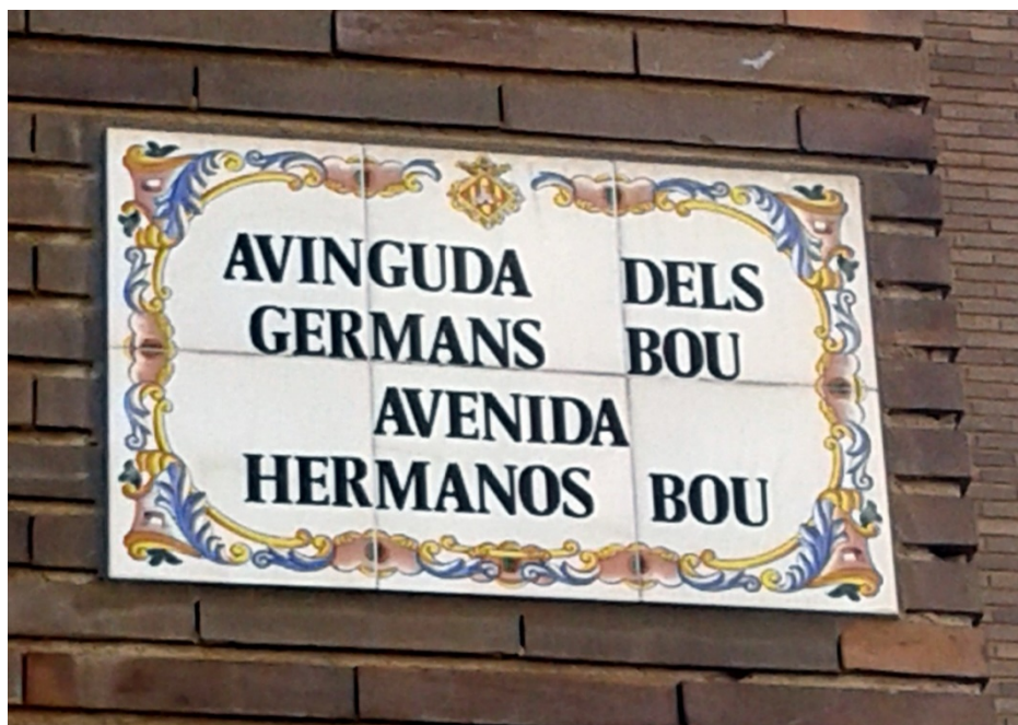
Placa actual instalada en la fachada de los juzgados de la PL. Juez Borrull

La avenida Hermanos Bou es una arteria muy importante en la ciudad de Castellón, antaño se la conocía popularmente como “El Camí la Mar”.