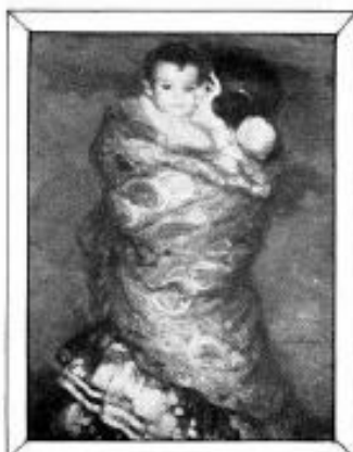
"El beso", óleo original de Juan Cardena.