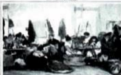
"LAS CIGARRERAS" OLEO DE GONZALO BILBAO