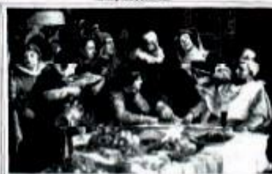
"EL BANQUETE A SANCHO" OLEO DE MORENO CARBONERO