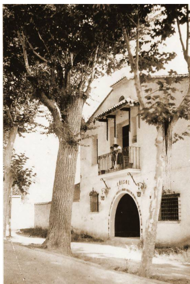
Fachada de la Cerámica el Crisol

Estos son algunos de los servicios que presta esta entidad.