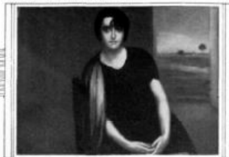
"LA NOVIA", Óleo de J. Romero de Torres.