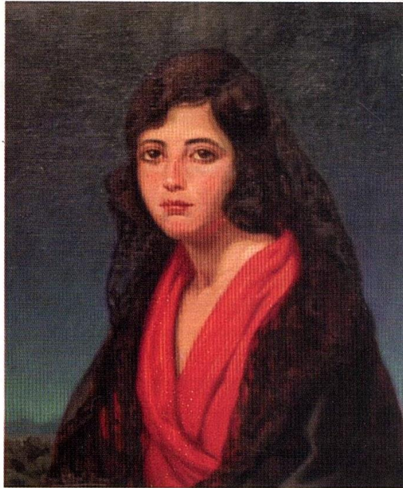
CRISTÓBAL BOU ALVARO. Carmen. C. 1928 Óleo sobre lienzo. 50 X 60 cm.