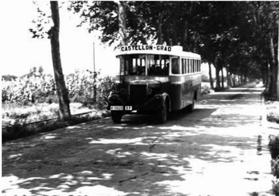
ANTIGUOS MEDIOS DE TRANSPORTE CIRCULANDO POR LA AVENIDA HERMANOS BOU.