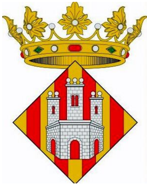
CASTELLÓN DE LA PLANA