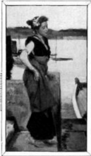
"ESPERANDO", Óleo de Joaquín Sorolla.