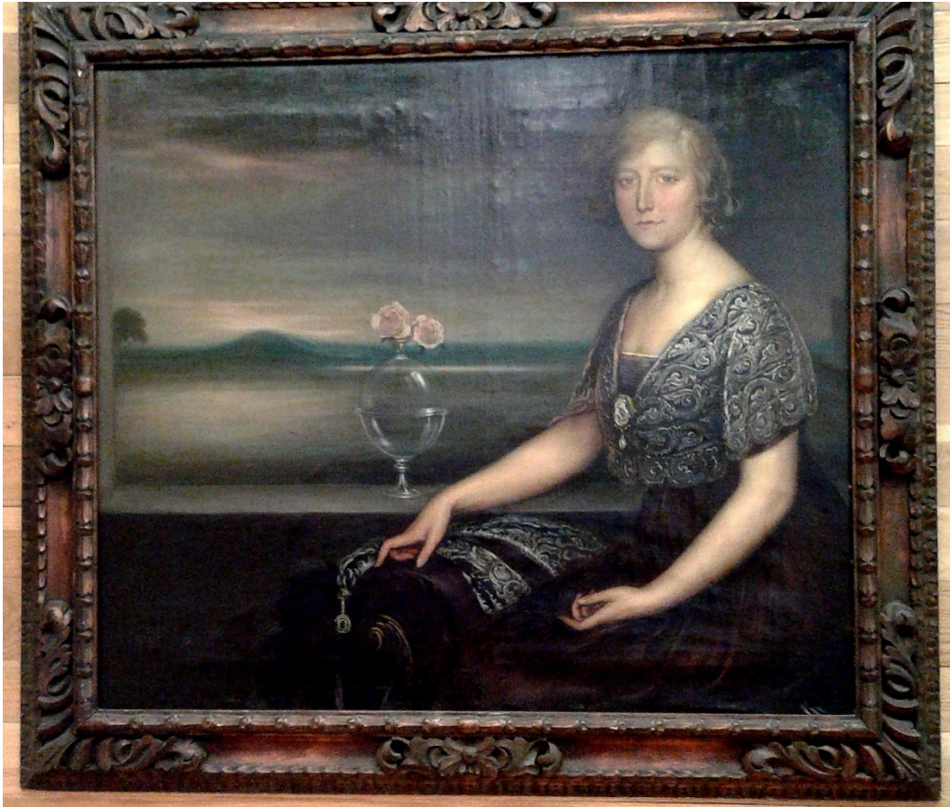
Julio Romero de Torres (Serenitat).

Junto a la fuente artística dedicada a los artistas (Ver página 10), también donada por el mecenas alcorino, fueron fundamento esencial para que Castellón, les agradiera dándole nombre a la Avenida.