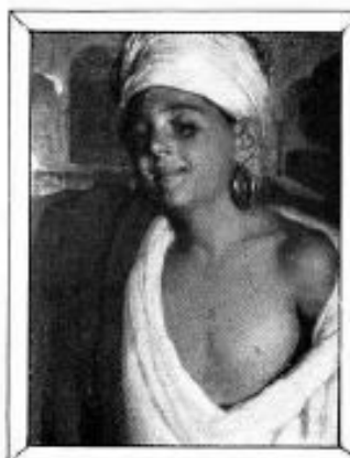
"La mora de Zelmira", óleo original de Ramón Casas.

Dado el mérito de los lienzos, es seguro que la exposición despertará mucho interés entre los numerosos aficionados.