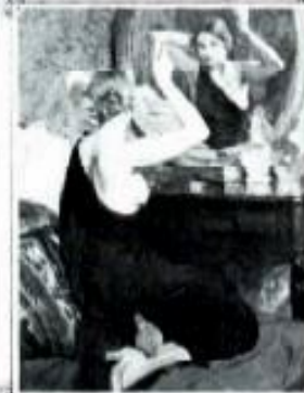
"ARMONIA EN ROJO" OLEO DE JUSTO BOU