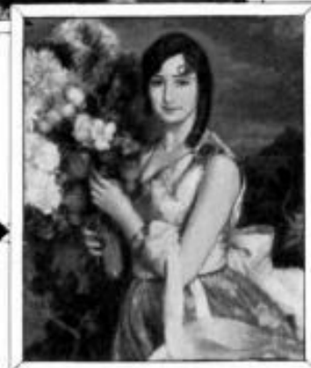
"PRIMAVERA", Óleo de Víctor Meys.