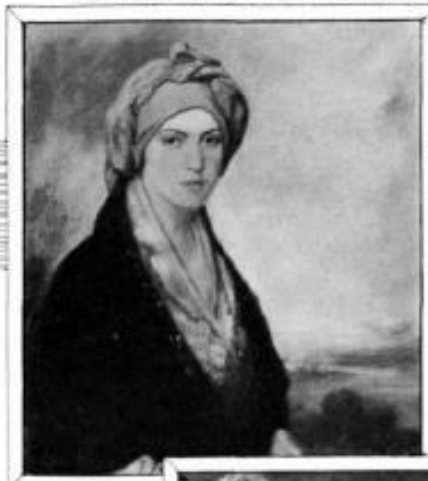
"CARMIRA", Óleo de F. Álvarez de Sotomayor.