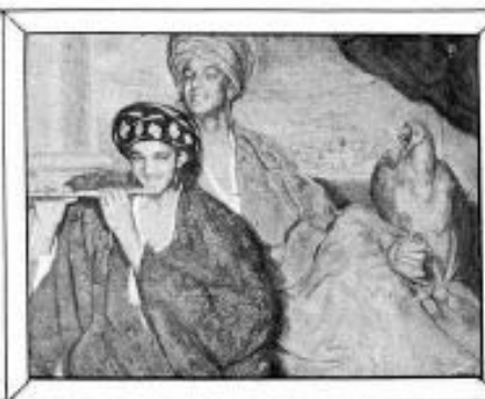
"Hecho crestas", óleo original de Gabriel Morillo.