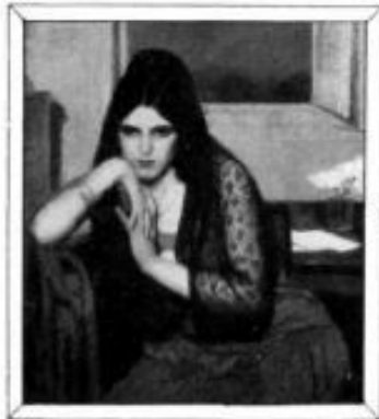
"HOSPITALIDAD", Óleo de Anselmo Miguel Nieto.