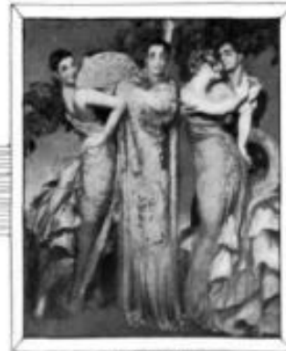
"VERBENA", Óleo de Néstor.