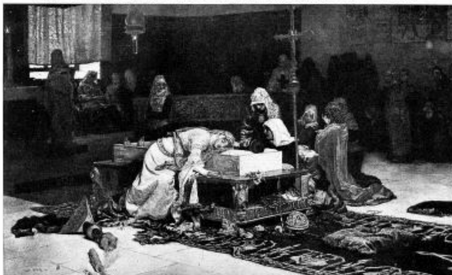
"Los amantes de Teruel" (lovers), original de Antonio Muñoz Degrain.