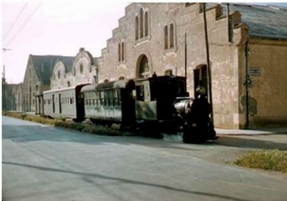
Publicación sobre La Panderola, de Juan J. Rubio, 9 enero 2009. Fotos de Charles F Firminger. 1961- Les Dench. 1962