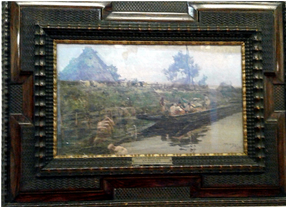
Francesc Pradilla. A trenc d'Alba.