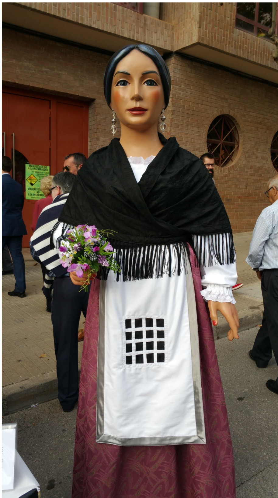
NELETA. Foto de la Colla de Gegants y Cabuts de l'Alcora 8 .