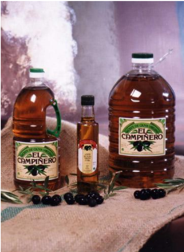
Aceite de oliva virgen extra