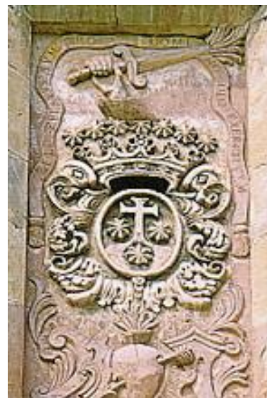
Detalle de la fachada