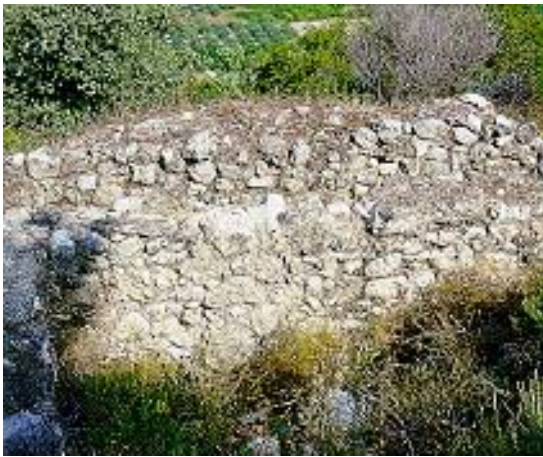
Poblado ibérico Cerro de Lucena