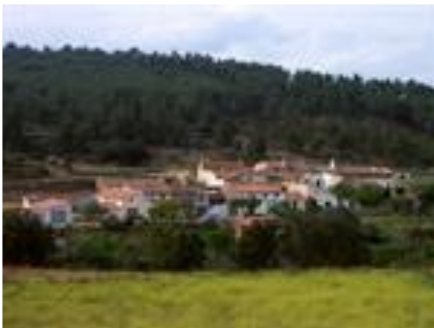
Caserío del Puntal

Importante caserío situado en la partida del mismo nombre, que según padrones municipales del S XVIII parece llamarse Cañada de la Sierra. Durante las guerras carlistas el cabecilla Juan Jover se estableció en este caserío mientras recogía voluntarios. A principios del S XX ya contaba con 12 casas y 46 habitantes. Hay restos de asentamiento de la edad del bronce. En el deslinde del año 1914 , tenía una superficie de 48 hectáreas y 64 áreas. Antes de llegar a Navalón de abajo tomar la pista de la derecha y al final lo encontraremos.