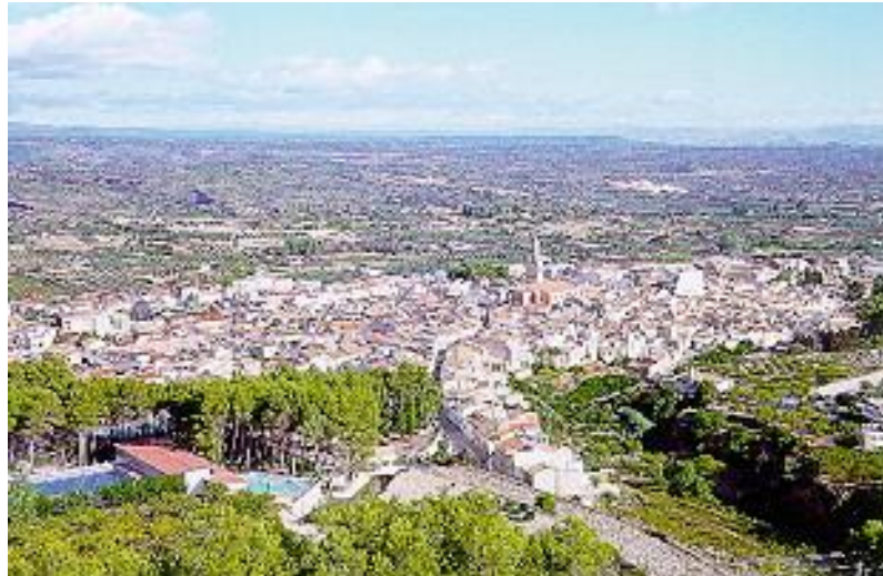
Vista de Enguera

El término municipal está atravesado por una serie de barrancos que desembocan en los ríos Escalona, Sellent y Cárdenas. Las precipitaciones, muy irregulares, oscilan en torno a los 420mm al año.