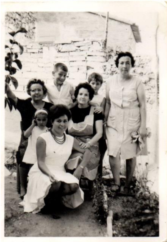
Enguera en los jardines de la Escuela y en el huerto familiar