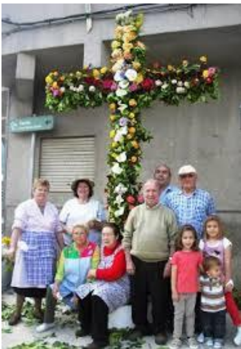
Cruz de mayo

El 1 de Mayo se celebran las cruces, la única que hay de madera se reviste de flores en la fuente del Plan.