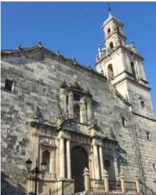
Iglesia de San Miguel