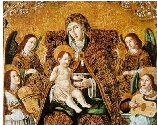
Retablo de la Virgen de Gracia