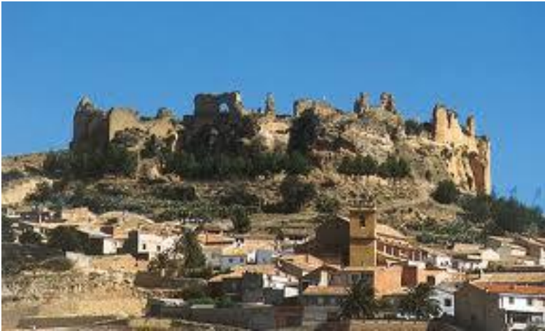
Castillo de Enguera

restos de la calzada que comunicaba ambos puntos. El castillo está declarado B.I.C. en fecha 27 de agosto de 2001.