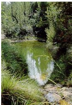
Manantial del morenillo

Fuente de Peña Roya, Manantiales de Río Grande, fuente de Benali, fuente Huesca , De la Rosa y fuente de las Arenas.