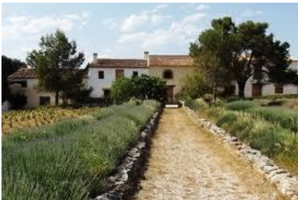
Caserío de Benali

El caserío de Benali se encuentra a 18 km de Enguera y se accede por la carretera que tiene su origen en la misma población. Claro exponente de un emplazamiento que en su día fue una alquería en el periodo de la dominación musulmana. El caserío antiguamente disponía de una torre “La torre de Benali”, hoy desaparecida, y de la que solo se aprecian parte de sus restos adosados a las viviendas cercanas y que proceden de épocas más reciente. Fue construida de tapial y sillarejo, a dicho cuerpo central se le agregan los demás edificios auxiliares, cuadras y corrales más o menos abiertos.