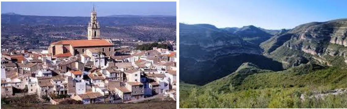
Vista y sierra de Enguera

No podemos dejar en el olvido los pueblos limítrofes: Quesa ,Bolvaite, Chella y Anna por el norte; el enclave de Xàtiva por el este; Montesa ,Vallada, Moixent y la Font de la Figuera por el sur y Almansa y Ayora por el oeste.