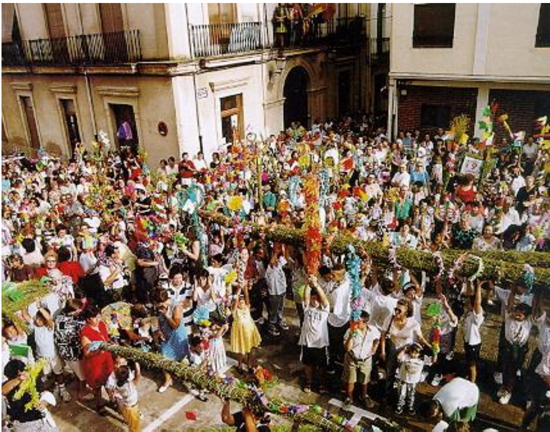
Fiesta de San Gil

El 1 de septiembre se celebra San Gil, única en España, siendo protagonistas los niños que acuden a la plaza de la Iglesia para bendecir los ramos de hinojo llamados "Sangil".Luego los llevan en procesión.