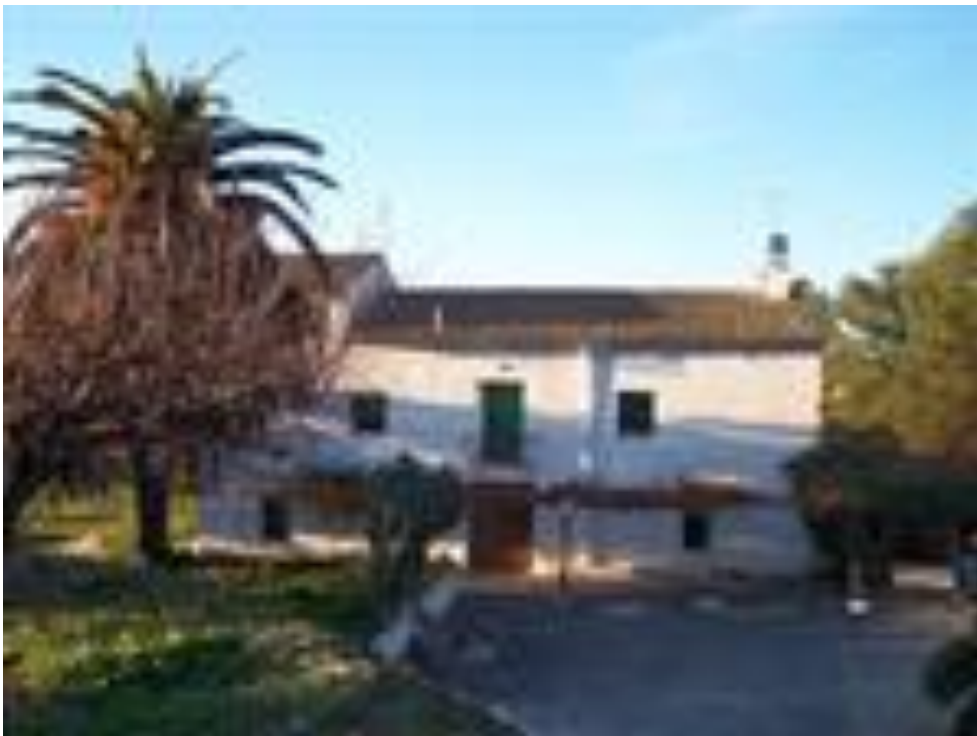
Caserío de Lucena

De esta fuente tengo muchos recuerdos pues íbamos a menudo con nuestra merienda.