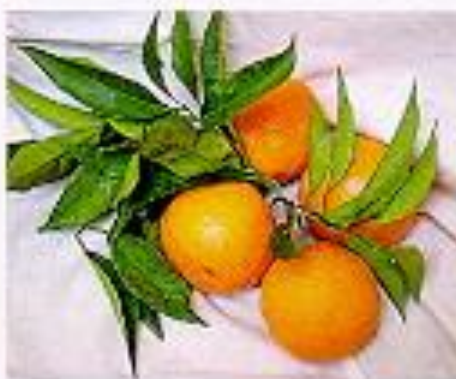
Productos de la tierra