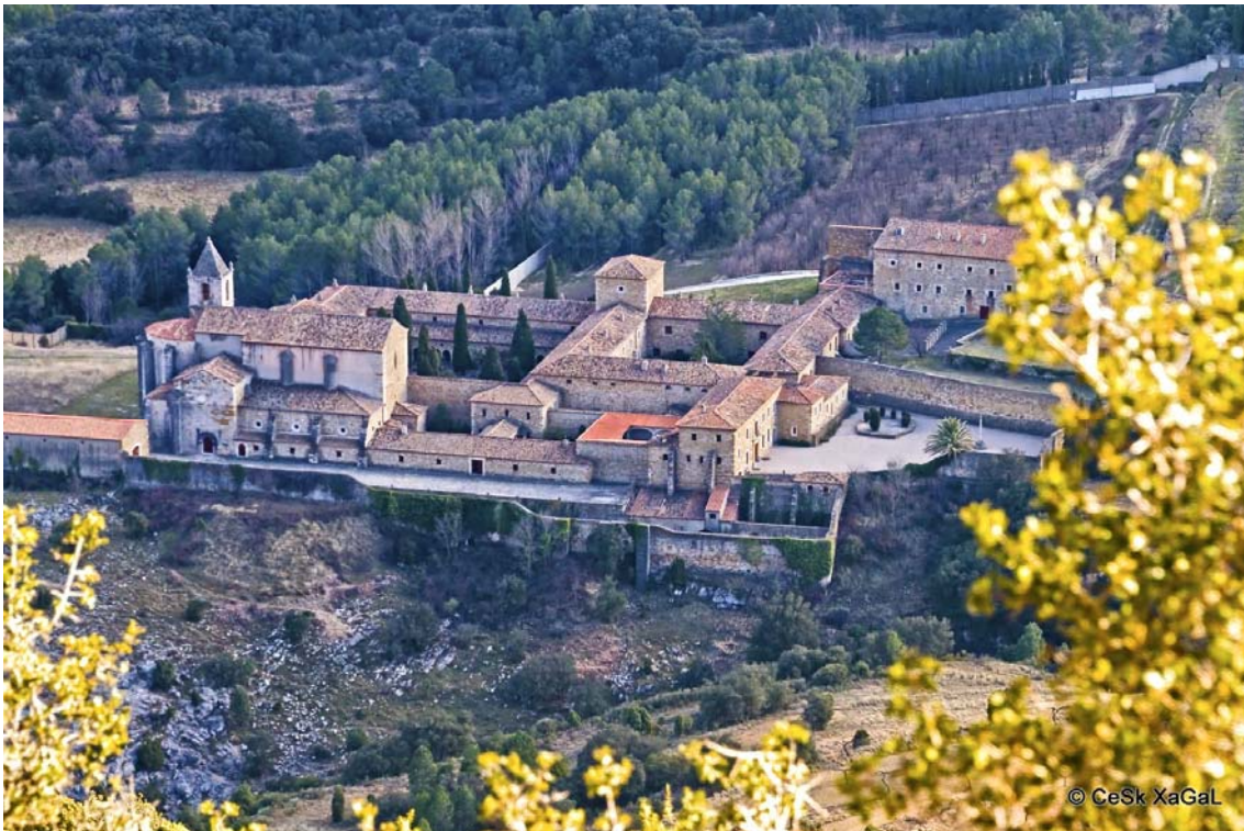
Monasterio de Santa Maria de Benifassa

En 1.237, Jaime I ordena construir un monasterio al lado del Castillo, bajo la advocación de Santa María. Primer convento cisterciense en tierras valencianas y que agruparía a los 7 pueblos de la Tinença, que pasaron a depender de su Abad.