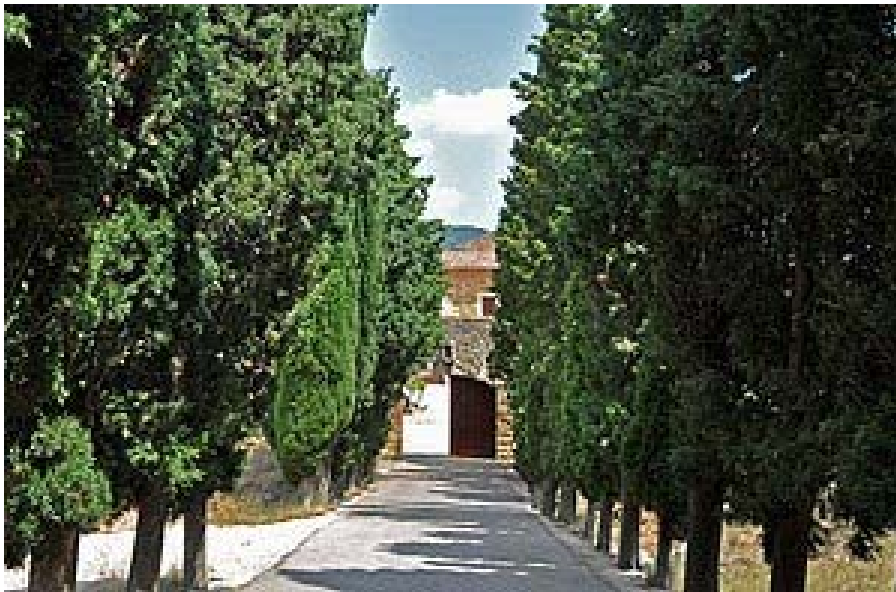
Entrada al monasterio, con sus preciosos cipreses, también llamado Cartuja de Santa María

El camino hacia el Monasterio tiene preciosos cipreses a ambos lados y sus jardines y alrededores tan bonitos y relajantes como toda la TINENÇA. Un lugar para visitar aunque solo se puede los jueves de 1 a 3 de la tarde.