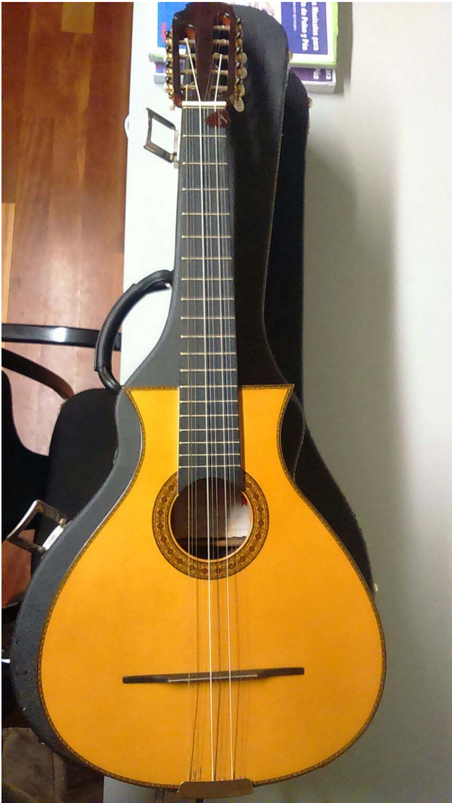
CITRA valenciana y tiene tres grupos de cuerdas afinadas E, B y F