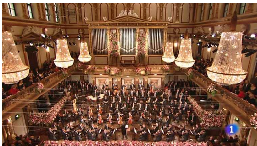
Concierto de Viena