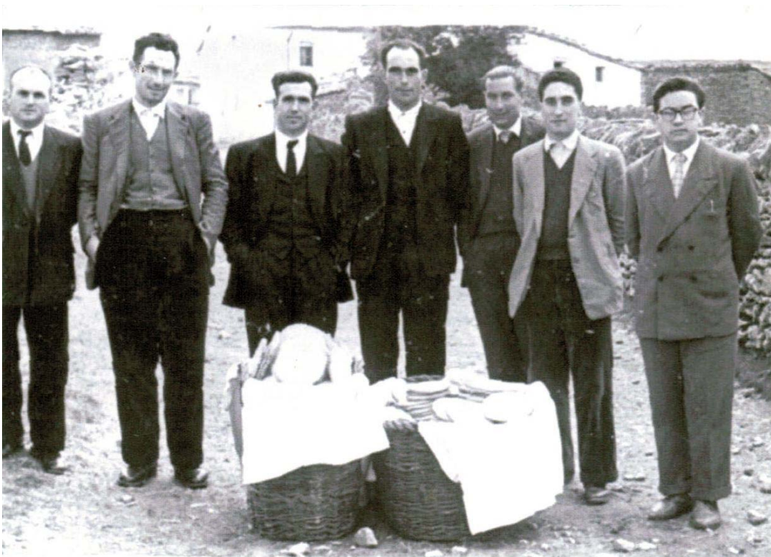
Foto de las primas

Después de la misa salían en procesión unos cientos de metros, se bendecían los campos a los cuatro puntos cardinales y también se bendecían las "primas", que se repartían a todos los asistentes.