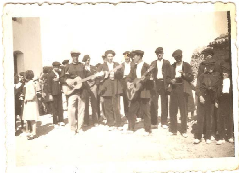
Foto de la rondalla

Los mayores se encargaban de buscar una rondalla para la fiesta que se hacía por la tarde, los músicos de la rondalla solían ser vecinos que tocaban varios instrumentos, la ronda siempre empezaba en la misma calle, pasaba por delante de la iglesia cantando por las calles hasta llegar a la plaza dónde empezaba el baile, con la jota. En algunos casos se contrataban aficionados y también profesionales que se dedicaban a ir por los alrededores a cantar y tocar música (cobraban con un duro de plata, 2 reales, o una peseta, y también por algunas comidas...).