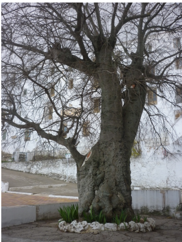
Figura 13. Latonero centenario situado en el recinto exterior del santuario.

En el siglo XVII es posible que sea el periodo de mas auge en la Cueva del Latonero que se convierte en un verdadero Santuario, la expulsión de los moriscos ayudo al culto a que la cueva del Latonero se convirtiera en Santa, ayudando a que se institucionalizaran los ritos y celebraciones en ella.