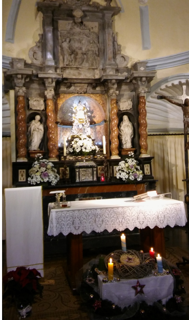
Figura 8. Virgen de la Cueva Santa en el altar, con su relicario.