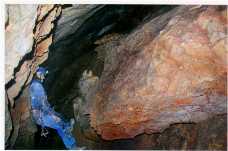
Figura 14. Bajada a la sima.

José Vicente Subías hizo un levantamiento topográfico siendo de gran valía de todo este trabajo para el conocimiento de la cueva.