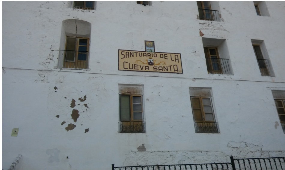
Figura 4. Hospedería de los Romeros devotos de la Virgen.