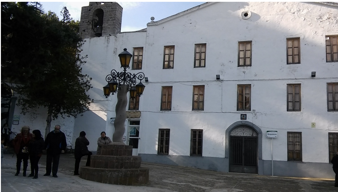
Figura 6. Plaza central del Santuario.

Referente a los edificios se puede ver que todo sigue igual, en su tiempo se edificó una hospedería para que los fieles pudieran quedarse a dormir en ella. El creciente fervor a la Virgen continua como en los tiempos que describimos. Toda la comarca tiene asignado un día al año para hacer su romería a esta cueva que para todos es santa.