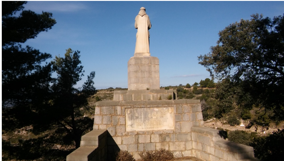
Figura 9. Estatua de Fray Bonifacio Ferrer (1955) erigida en desagravio de que se profanaron sus restos durante la Guerra Civil.

restos descansan en la entrada de la cueva Santa en una de las capillas laterales, donde los devotos reconocen todo su trabajo en honor a la virgen. Sus restos estaban en el Santuario desde 1917 por mandato de Fray Luis Amigó.