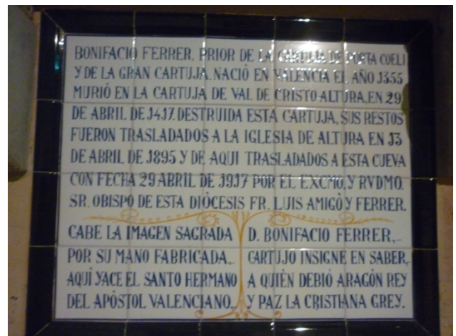
Figura 10. Izda: Sepulcro de Fray Bonifacio Ferrer en el interior del santuario. Dcha: Detalle de la leyenda que acompaña al sepulcro.