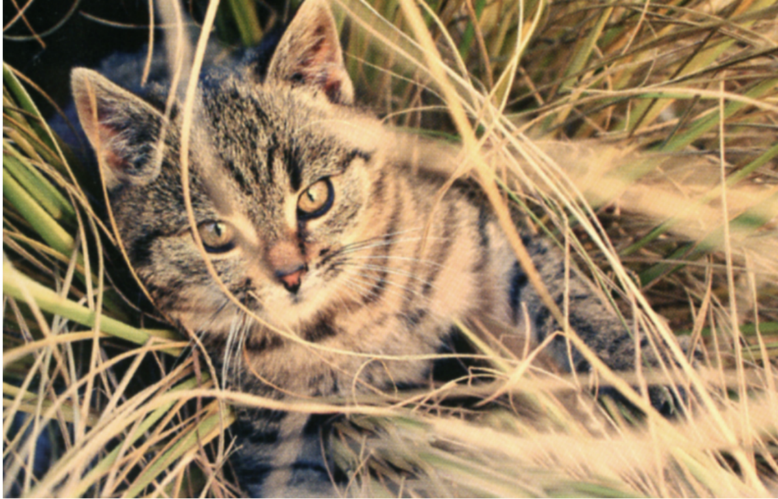
Figura 20. Gato montés. Fotografía del grupo espeleológico “La Señera”.