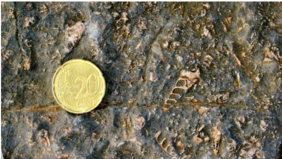
Figura 17. Calizas del jurásico con gasterópodos en el entorno del santuario.