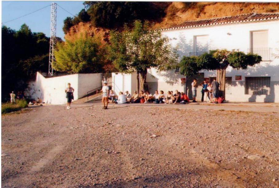
Figura 1. Romeros en una parada de descanso hacia la Cueva Santa en la Masía de Ribas.

construye el edificio lindante a la cueva rindiendo cuentas todos los años al Obispo de Segorbe.