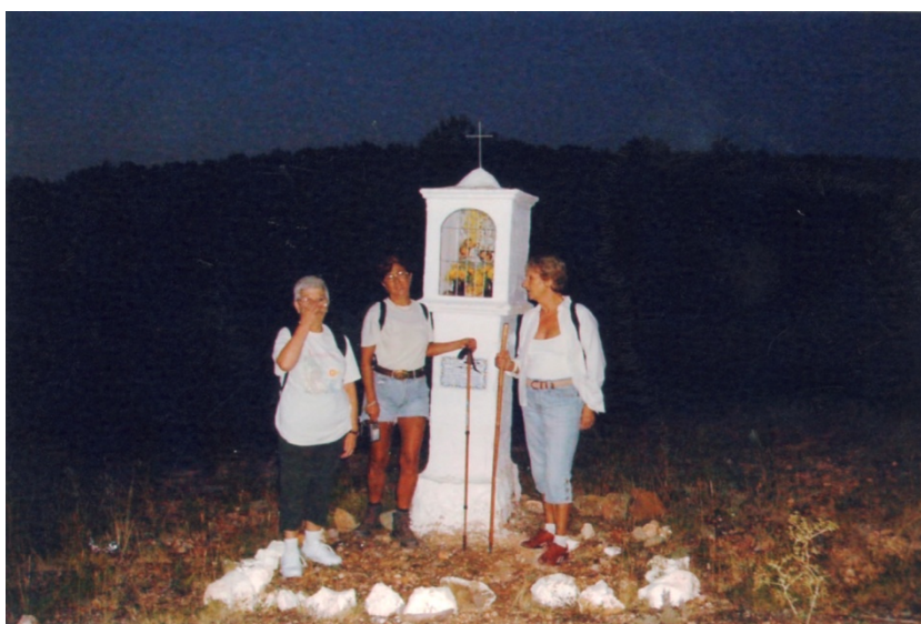
Figura 7. Capillita de la Virgen camino del santuario.

En la Cartuja de Vall de Crist, fray Bonifacio Ferrer llega a ostentar el cargo de Prior Mayor. Se dice que San Ignacio de Loyola residió temporalmente en la Cartuja de Vall de Crist. También estuvo el Papa Benedicto XIII llamado Papa Luna, tío de María de Luna, Señora de Segorbe, esposa de Martin el Humano .