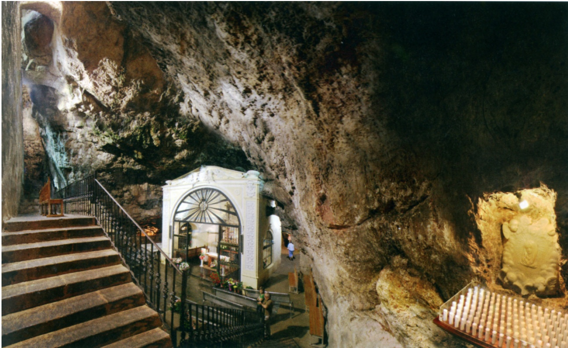
Figura 11. Bóveda caliza de la cueva santuario.