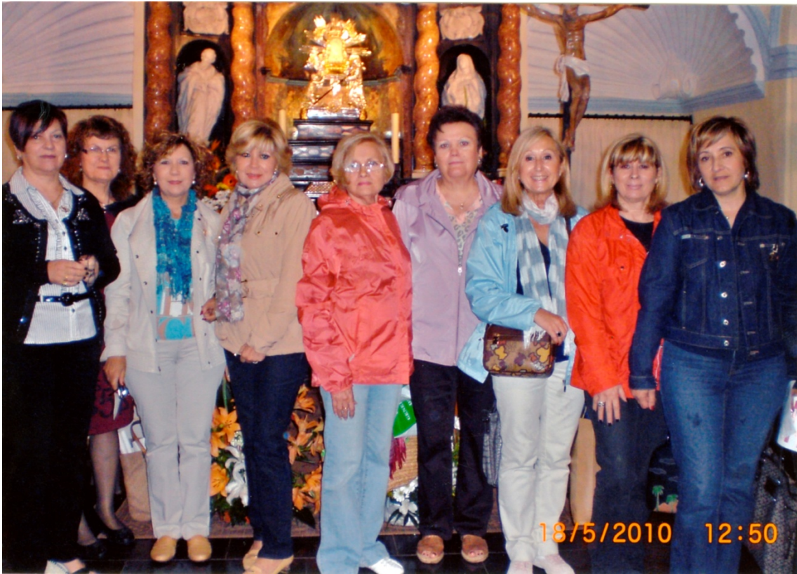
Figura 12. Junta directiva de la Asociación de Mujeres de Segorbe ante el altar de la Virgen la mañana de la noche anterior a su robo.