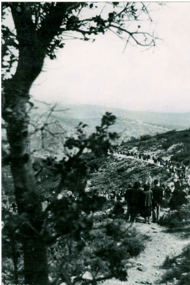
Figura 5. Romería hacia la Cueva Santa en el año 1949.