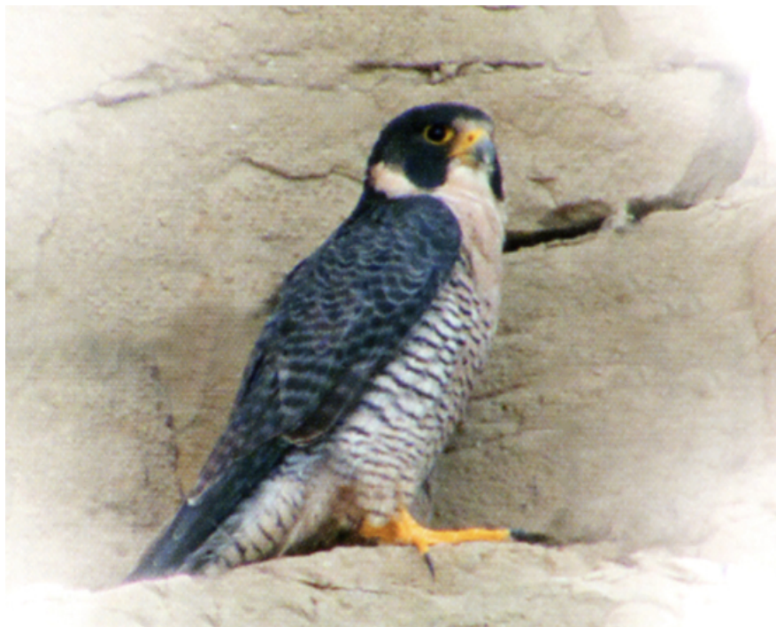
Figura 19. Halcón peregrino.