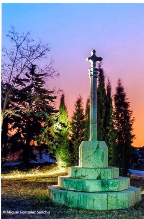
Figura 2. Cruz de la Masía de Ribas.