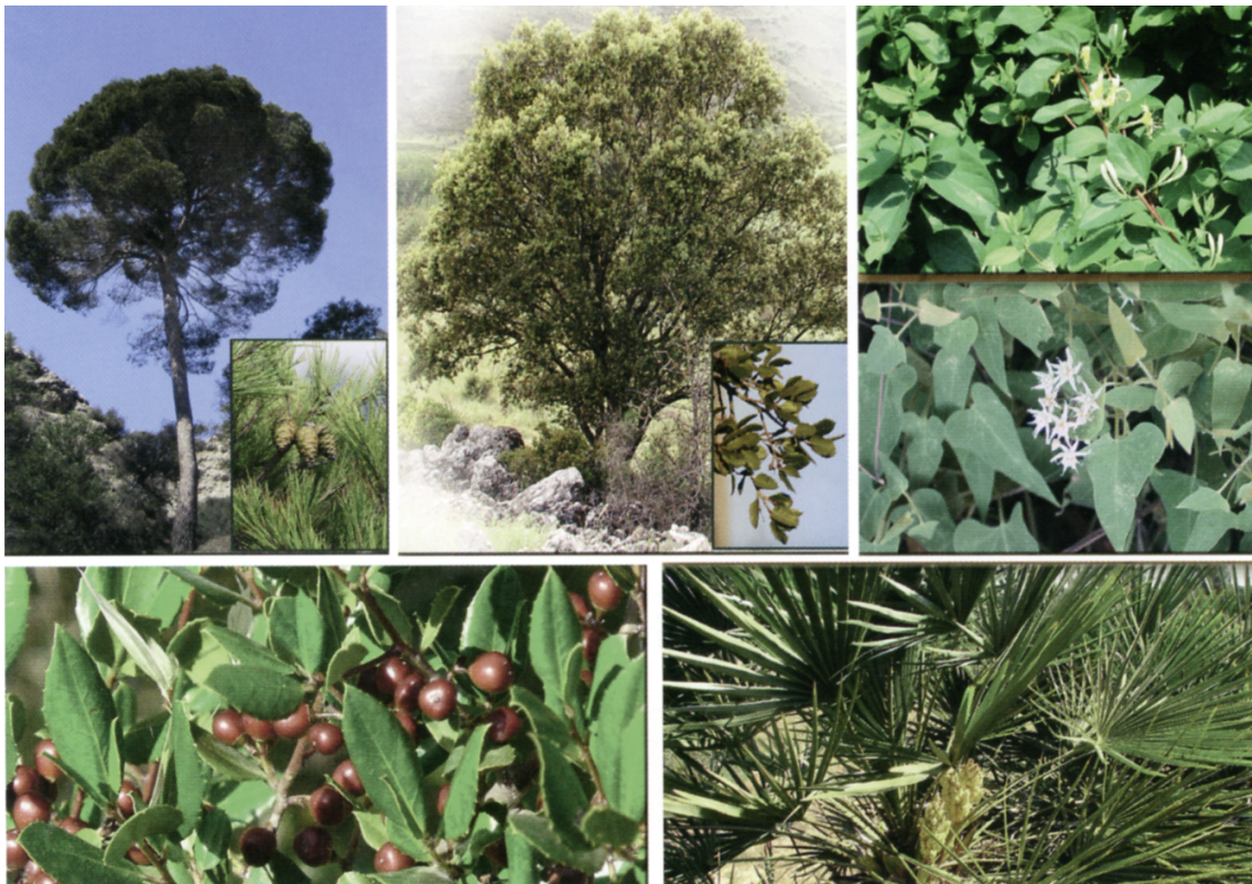
Figura 18. Vegetación característica del entorno de la Cueva santa.