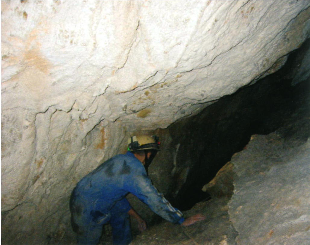
Figura 16. Entrada a la sala del Fraile con paredes de “moonmilk”.