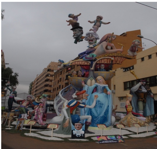
FALLA EL PALLETER

Fallas Ganadoras en las distintas categorías en el ejercicio 2016 para observar las diferencias con el presupuesto por secciones.