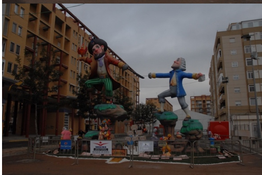
FALLA ELS VENTS